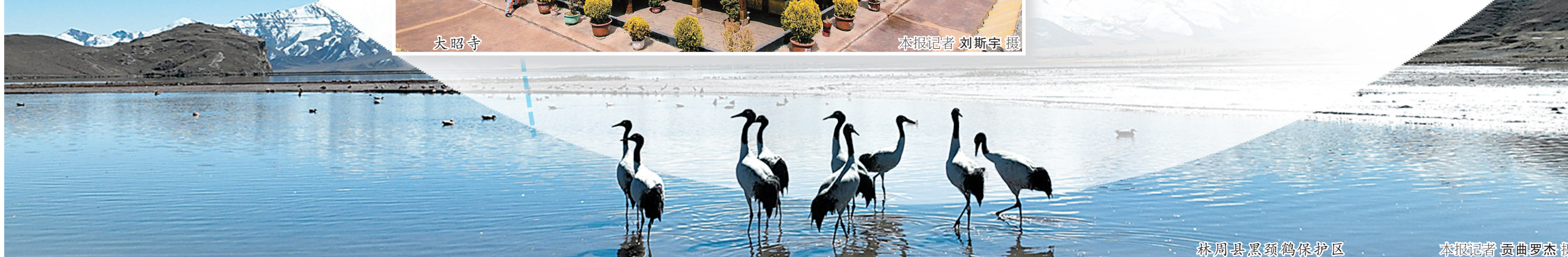
林周县黑颈鹤保护区