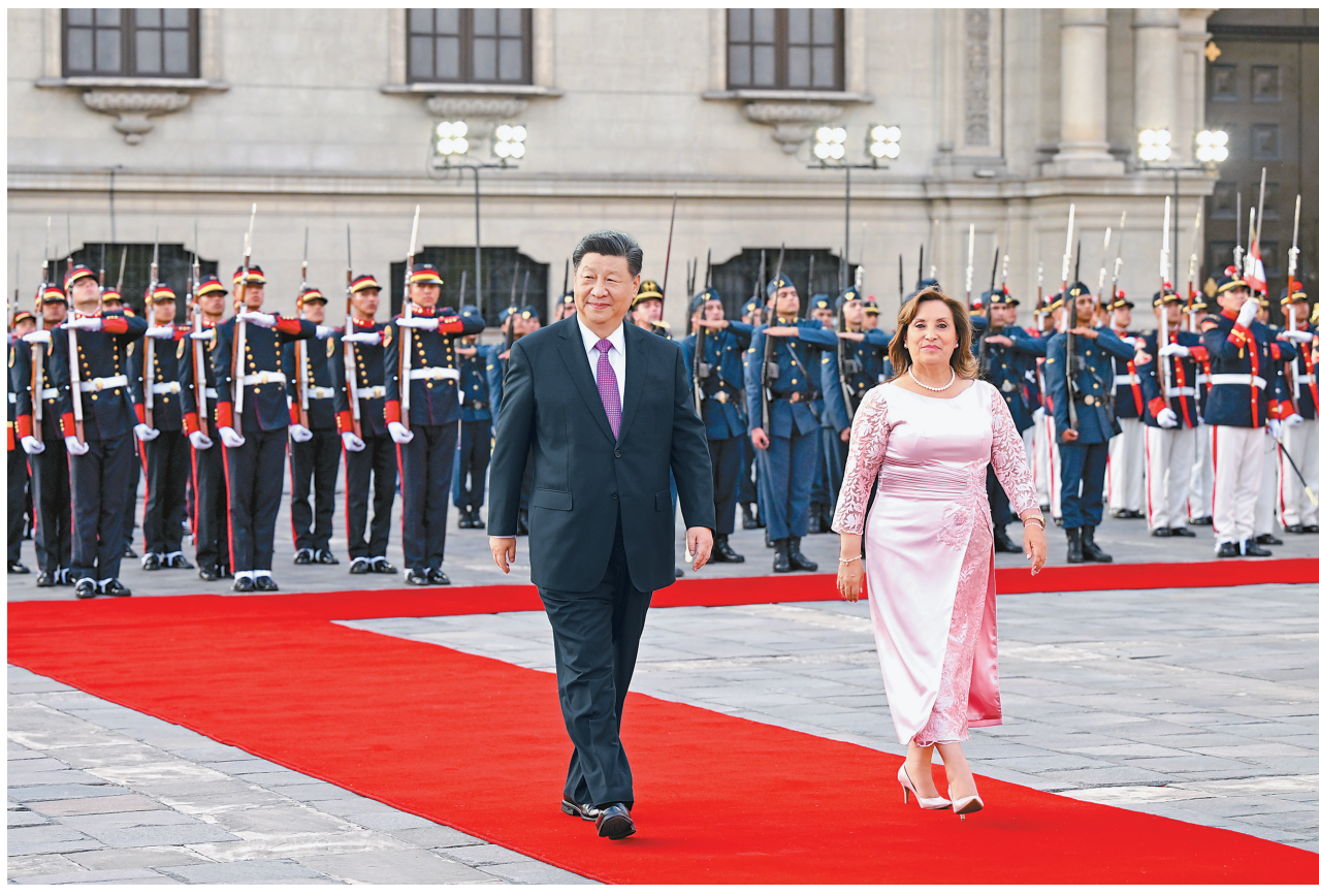
当地时间11月14日下午,国家主席习近平在利马总统府同秘鲁总统博鲁阿尔特举行会谈。博鲁阿尔特在总统府前广场为习近平举行隆重盛大欢迎仪式。