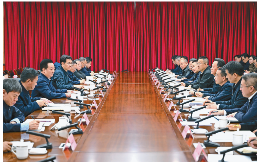
11月13日至15日,自治区党委书记王君正深入日喀则市仁布县、谢通门县、南木林县、桑珠孜区、经开区调研。这是调研期间王君正听取日喀则市工作汇报。

本报日喀则11月15日电(记者张黎黎 刘文涛)13日至15日,自治区党委书记王君正深入日喀则市仁布县、谢通门县、南木林县、桑珠孜区、经开区调研。强调,要深入学习贯彻党的二十大精神