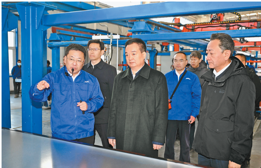
11月13日至15日,自治区党委书记王君正深入日喀则市仁布县、谢通门县、南木林县、桑珠孜区、经开区调研。这是王君正在日喀则日出东方清洁能源有限公司了解生产相关情况。