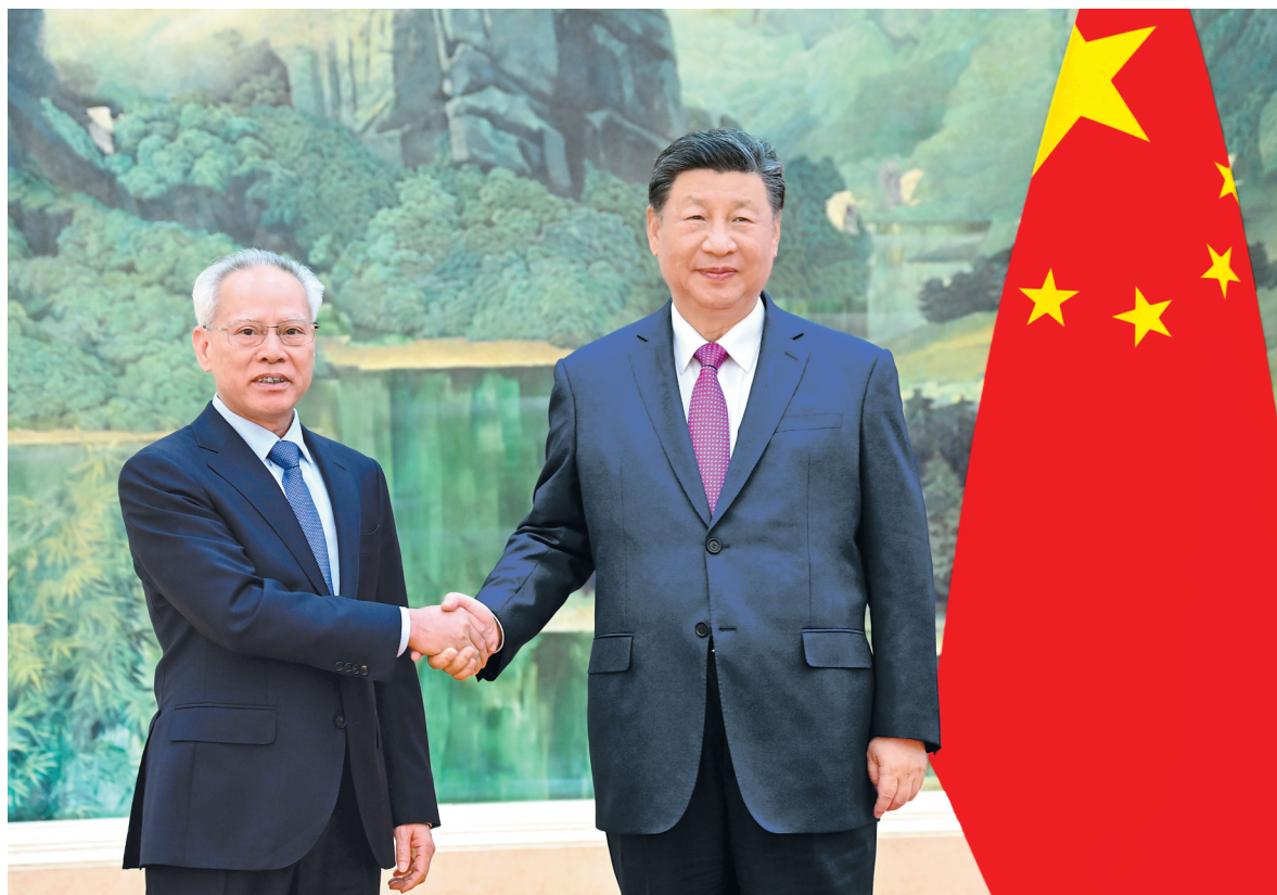
十一月一日下午，国家主席习近平在北京人民大会堂会见新当选并获中央人民政府任命的澳门特别行政区第六任行政长官岑浩辉。

新华社北京11月1日电 国家主席习近平11月1日下午在人民大会堂会见了新当选并获中央人民政府任命的澳门特别行政区第六任行政长官岑浩辉。