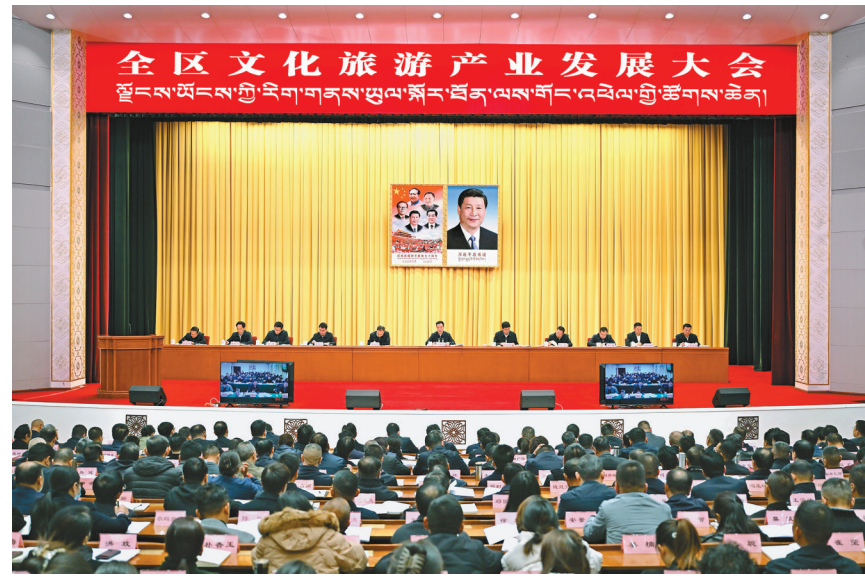
10月22日上午,全区文化旅游产业发展大会在拉萨召开。自治区党委书记王君正出席并讲话。这是大会现场。

本报拉萨10月23日讯(记者 张黎 黎 张尚华)22日上午,全区文化旅游产业发展大会在拉萨召开。自治区党委书记王君正出席并讲话。强调,要深入学习贯彻党的二十大和二十届三中全会精神,坚持以习近平总书记重要指示统揽文化旅游工作全局,科学把握形势、明确目标任务,努力把文化旅游产业打造成为支柱产业,奋力推进社会主义现代化新西藏建设。