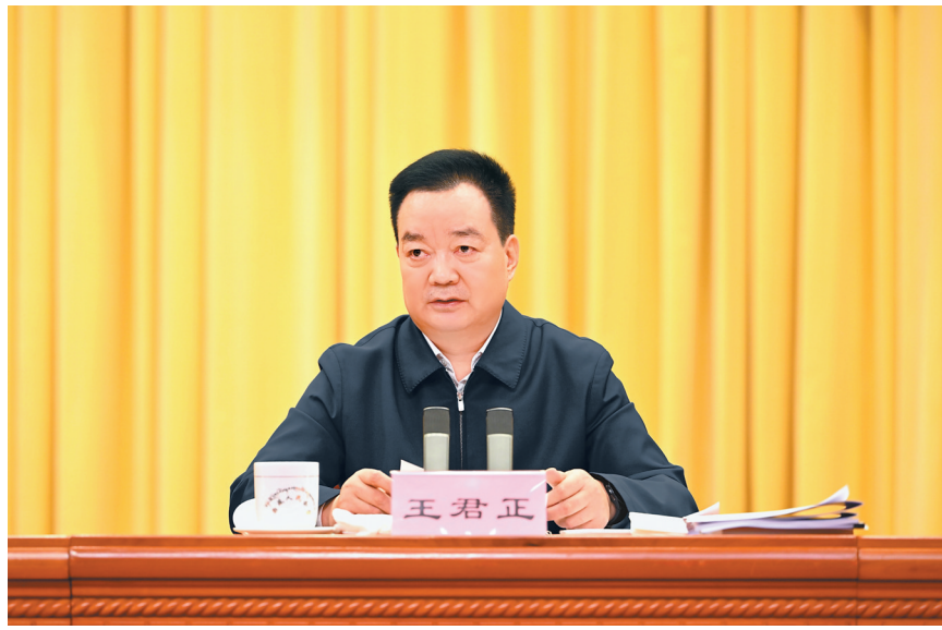
10月22日上午,全区文化旅游产业发展大会在拉萨召开。自治区党委书记王君正出席并讲话。