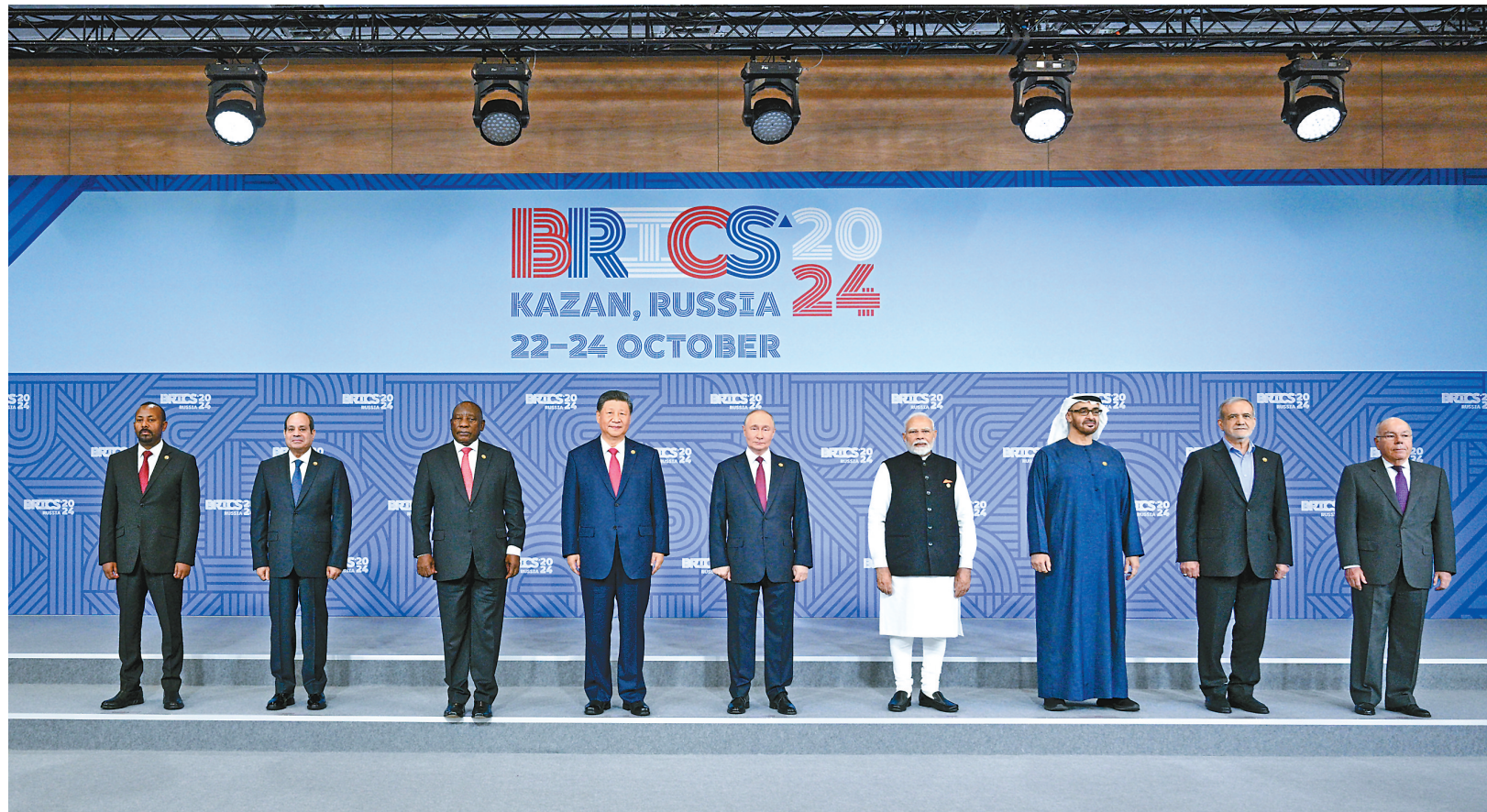
当地时间10月23日上午,金砖国家领导人第十六次会晤在喀山会展中心举行。俄罗斯总统普京主持会晤。中国国家主席习近平、巴西总统卢拉(线上)、埃及总统塞西、埃塞俄比亚总理阿比、印度总理莫迪、伊朗总统佩泽希齐扬、南非总统拉马福萨、阿联酋总统穆罕默德等出席。习近平发表重要讲话。