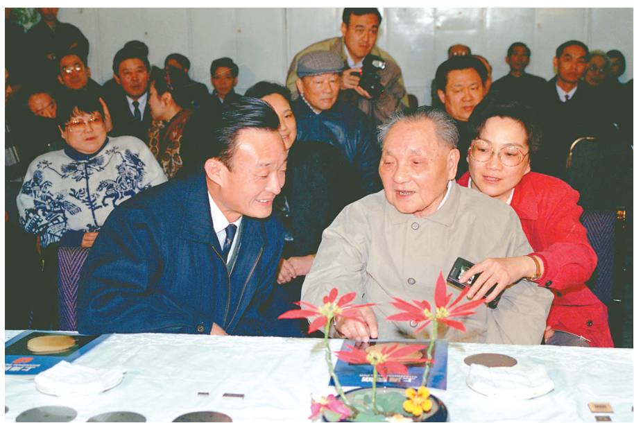
1992年2月10日,邓小平同志在上海贝岭微电子制造有限公司参观时与吴邦国同志交谈。