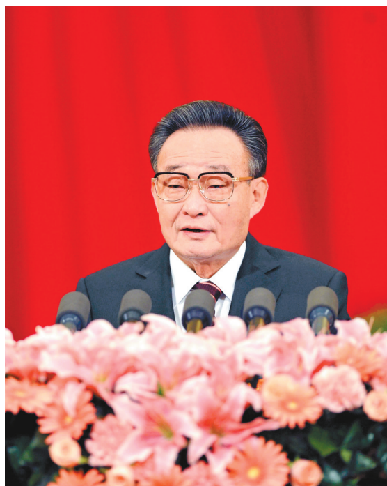
2011年3月10日,十一届全国人大四次会议在北京人民大会堂举行第二次全体会议。吴邦国同志作全国人大常委会工作报告。