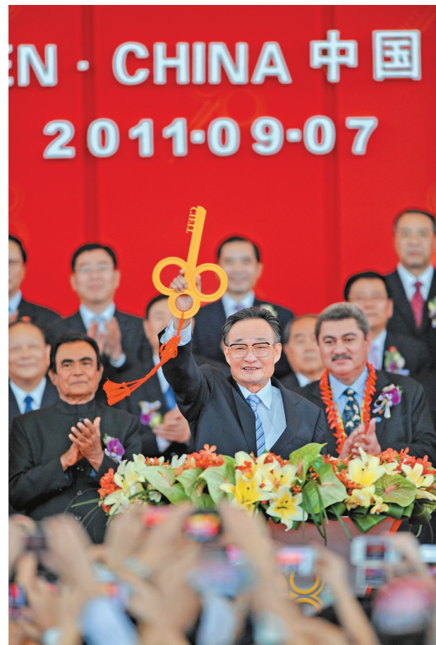
2011年9月7日,吴邦国同志在福建厦门出席第十五届中国国际投资贸易洽谈会开幕式。