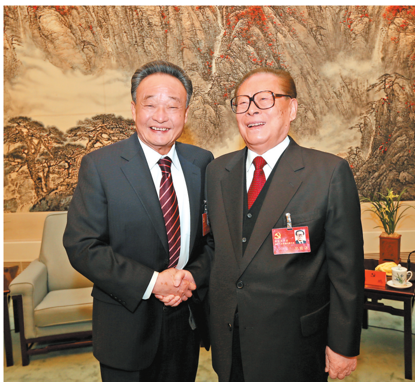
2012年11月14日,中国共产党第十八次全国代表大会在北京闭幕。这是闭幕会前,江泽民同志与吴邦国同志在一起。