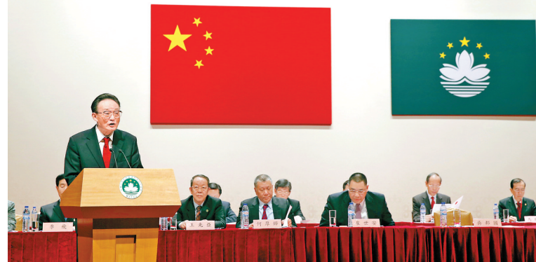
2013年2月21日,吴邦国同志在澳门文化中心出席澳门社会各界纪念澳门基本法颁布20周年启动大会并发表讲话。