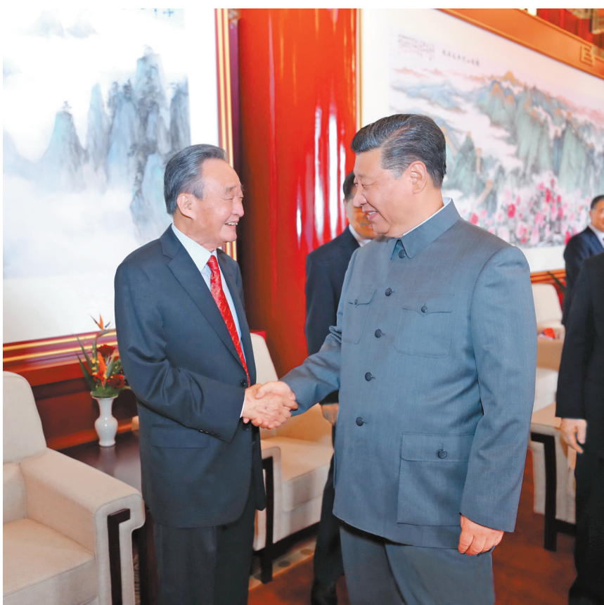
2021年7月1日,庆祝中国共产党成立100周年大会在北京天安门广场隆重举行。这是庆祝大会前,习近平同志与吴邦国同志握手。