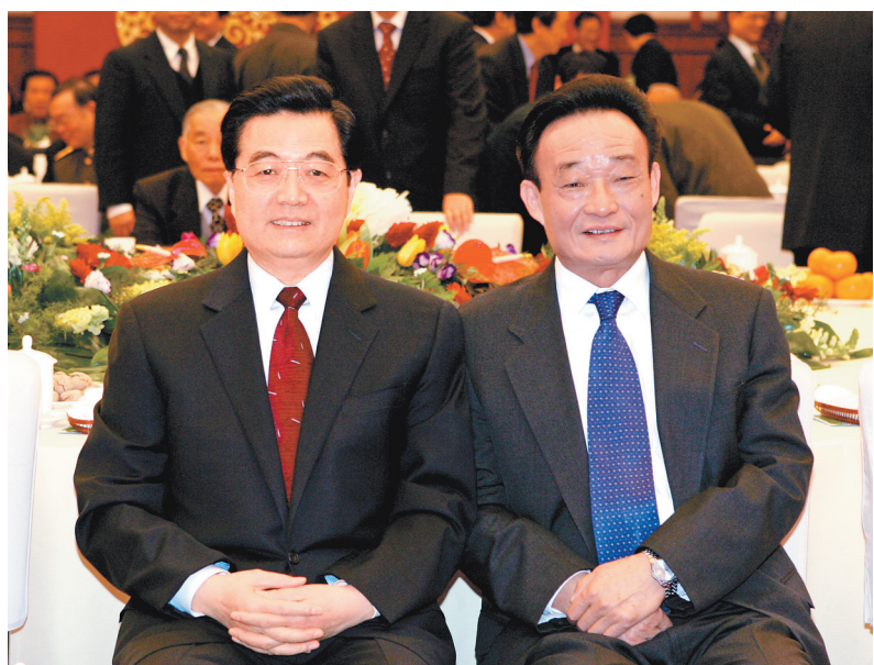
二〇〇五年一月一日,全国政协在北京举行新年茶话会。这是胡锦涛同志与吴邦国同志在一起。