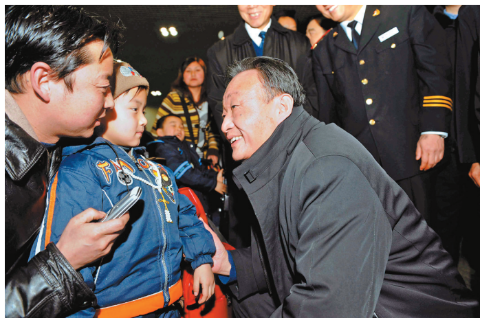
2008年2月3日,吴邦国同志在北京西站候车室与旅客交谈。