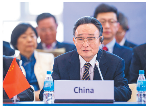
2013年1月28日,吴邦国同志在俄罗斯符拉迪沃斯托克出席亚太会议论坛第21届年会,并作题为《坚持和平发展 促进合作共赢》的主旨发言。