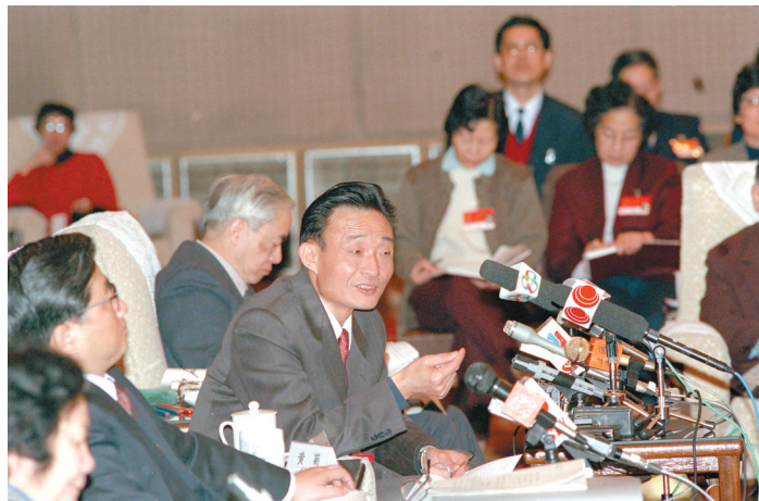
1994年3月,时任上海市委书记的吴邦国同志在全国两会上代表上海代表团发言。

如期基本实现。他高度重视加快现代企业制度建设,按照“产权清晰、权责明确、政企分开、管理科学”的要求,积极推行规范的公司制和股份制改革,完善法人治理结构,深化企业内部分配、人事、劳动制度改革,推动国有大中型骨干企业建立现代企业制度。他着力推动建立企业优胜劣汰机制,坚持从战略上调整国有经济布局和改组国有企业,支持具有优势的大公司大企业集团进一步做强做大,使其成为国民经济重要支柱和参与国际竞争主要力量。他十分重视企业管理创新,大力推进企业信息化建设,推动加强成本管理、资金管理和质量管理,不断提高企业现代化管理水平。他始终把就业摆在突出位置,坚持实行鼓励兼并、规范破产、下岗分流、减员增效和实施再就业工程的方针,推动制定出台一整套符合基本国情、顺应时代发展要求的促进就业再就业政策,加强社会保障体系建设,为社会大局稳定、国民经济健康发展创造良好条件。