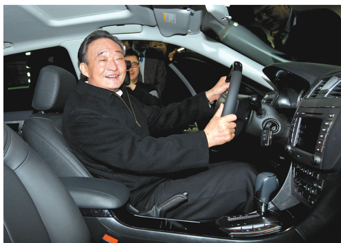
2010年1月30日,吴邦国同志在上海汽车集团股份有限公司技术中心察看新能源样车。新华社记者 姚大伟 摄

1983年3月,吴邦国同志任上海市委常委,同年8月兼任上海市委科技工作党委书记。他深入了解情况,加强科技系统领导班子建设,推动科研与生产相结合。1985年6月,他任上海市委副书记,分管党群和市委日常工作,注重结合实际贯彻落实党中央大政方针,围绕加强党的干部队伍建设等进行专题研究,在市委决策方面发挥了重要作用。1989年春夏之交的政治风波中,吴邦国同志旗帜鲜明拥护党中央重大决策,与上海市委主要领导一道,顶住压力,稳定秩序,采取有力措施制止动乱。