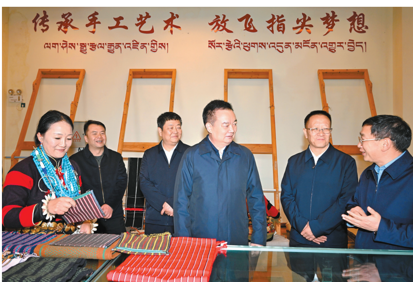
10月6日至7日，自治区党委书记王君正在林芝市巴宜区、米林市调研。这是王君正来到米林市南伊洛巴民族乡才召村，详细了解乡村振兴、群众增收、传统技艺传承与发展、民族团结进步等工作。