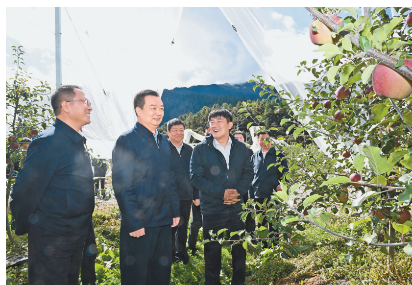
10月6日至7日，自治区党委书记王君正在林芝市巴宜区、米林市调研。这是王君正在巴宜区百巴镇增巴村烟台大果业开发有限公司的苹果种植点了解产业发展等情况。