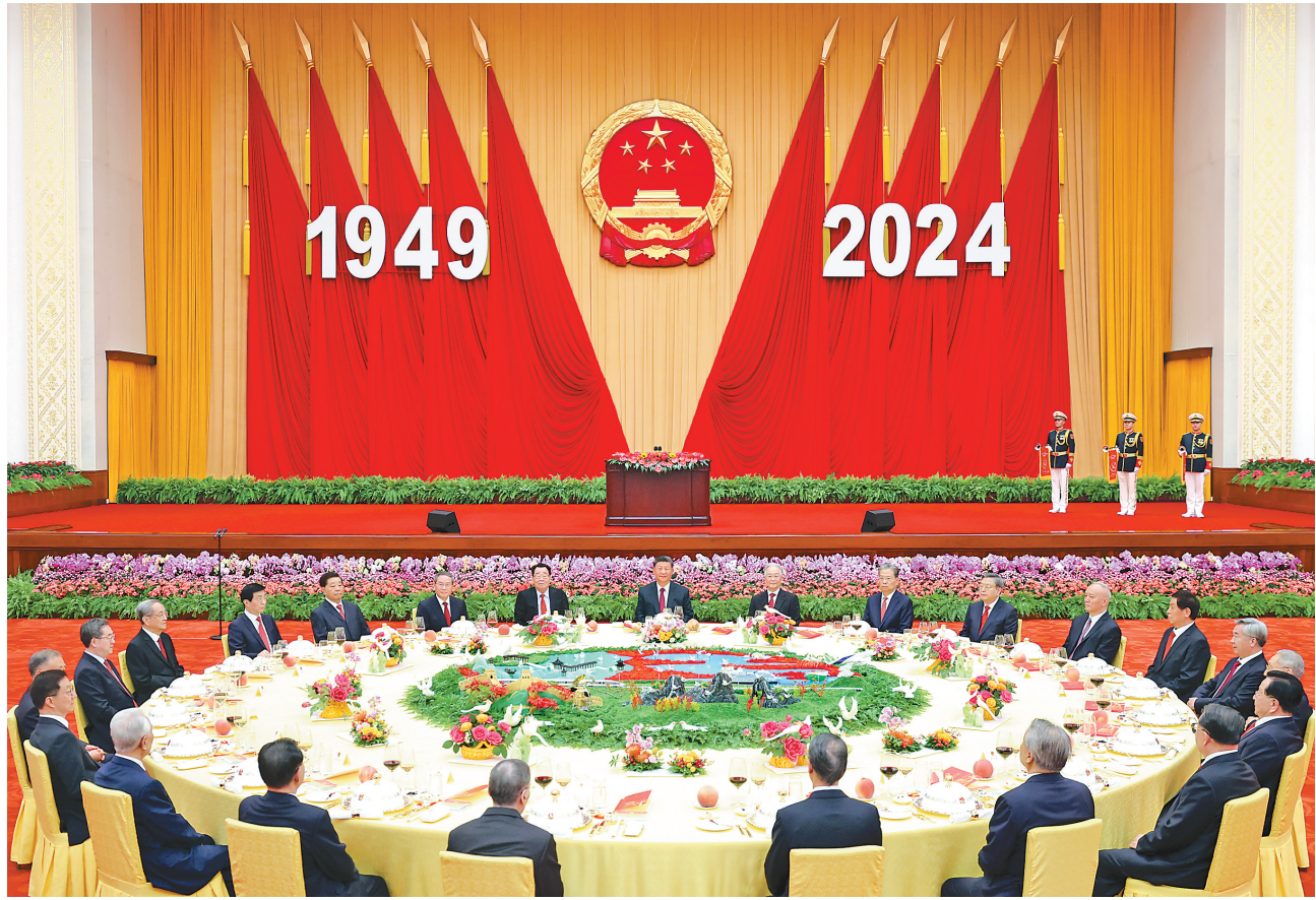
9月30日晚,庆祝中华人民共和国成立75周年招待会在北京人民大会堂隆重举行。习近平、李强、赵乐际、王沪宁、蔡奇、丁薛祥、李希、韩正等党和国家领导人与约3000名中外人士欢聚一堂,共庆新中国75周年华诞。

新华社北京9月30日电 庆祝中华人民共和国成立75周年招待会30日晚在人民大会堂隆重举行。中共中央总书记、国家主席、中央军委主席习近平出席招待会并发表重要讲话。他强调,中华人民共和国成立75年来,我们党团结带领全国各族人民不懈奋斗,创造了经济快速发展和社会长期稳定两大奇迹,中国发生沧海桑田的巨大变化,中华民族伟大复兴进入了不可逆转的历史进程。新时代新征程,中国人民必将创造出新的更大辉煌,必将为人类和平和发展的崇高事业作出新的更大贡献。 李强主持招待会,赵乐际、王沪宁、蔡奇、丁薛祥、李希、韩正出席招待会。约3000名中外人士欢聚一堂,共庆新中国75周年华诞。