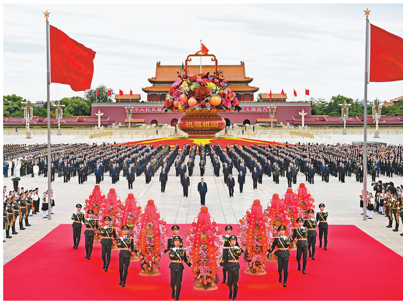
9月30日上午,党和国家领导人习近平、李强、赵乐际、王沪宁、蔡奇、丁薛祥、李希、韩正等来到北京天安门广场,出席烈士纪念日向人民英雄敬献花篮仪式。

新华社北京9月30日电 在庆祝中华人民共和国成立75周年之际,烈士纪念日向人民英雄敬献花篮仪式30日上午在北京天安门广场隆重举行。党和国家领导人习近平、李强、赵乐际、王沪宁、蔡奇、丁薛祥、李希、韩正等,同