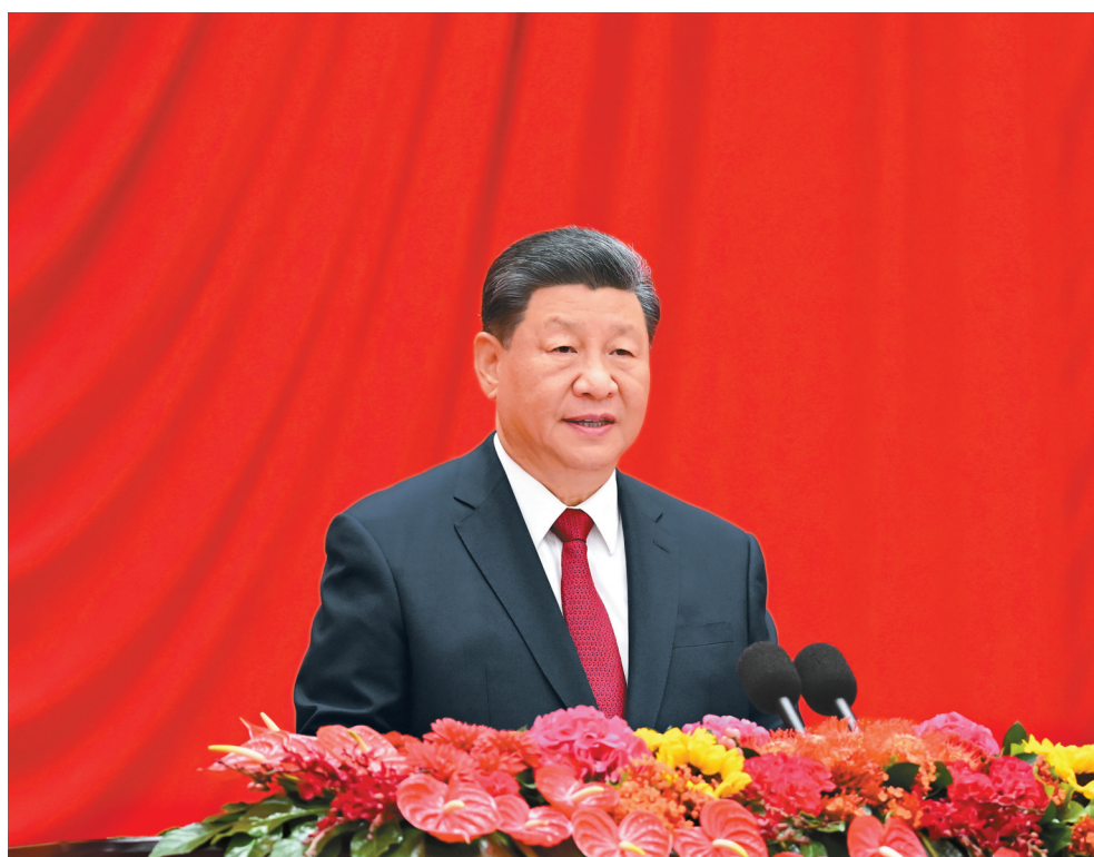
9月30日晚,庆祝中华人民共和国成立75周年招待会在北京人民大会堂隆重举行。中共中央总书记、国家主席、中央军委主席习近平出席招待会并发表重要讲话。