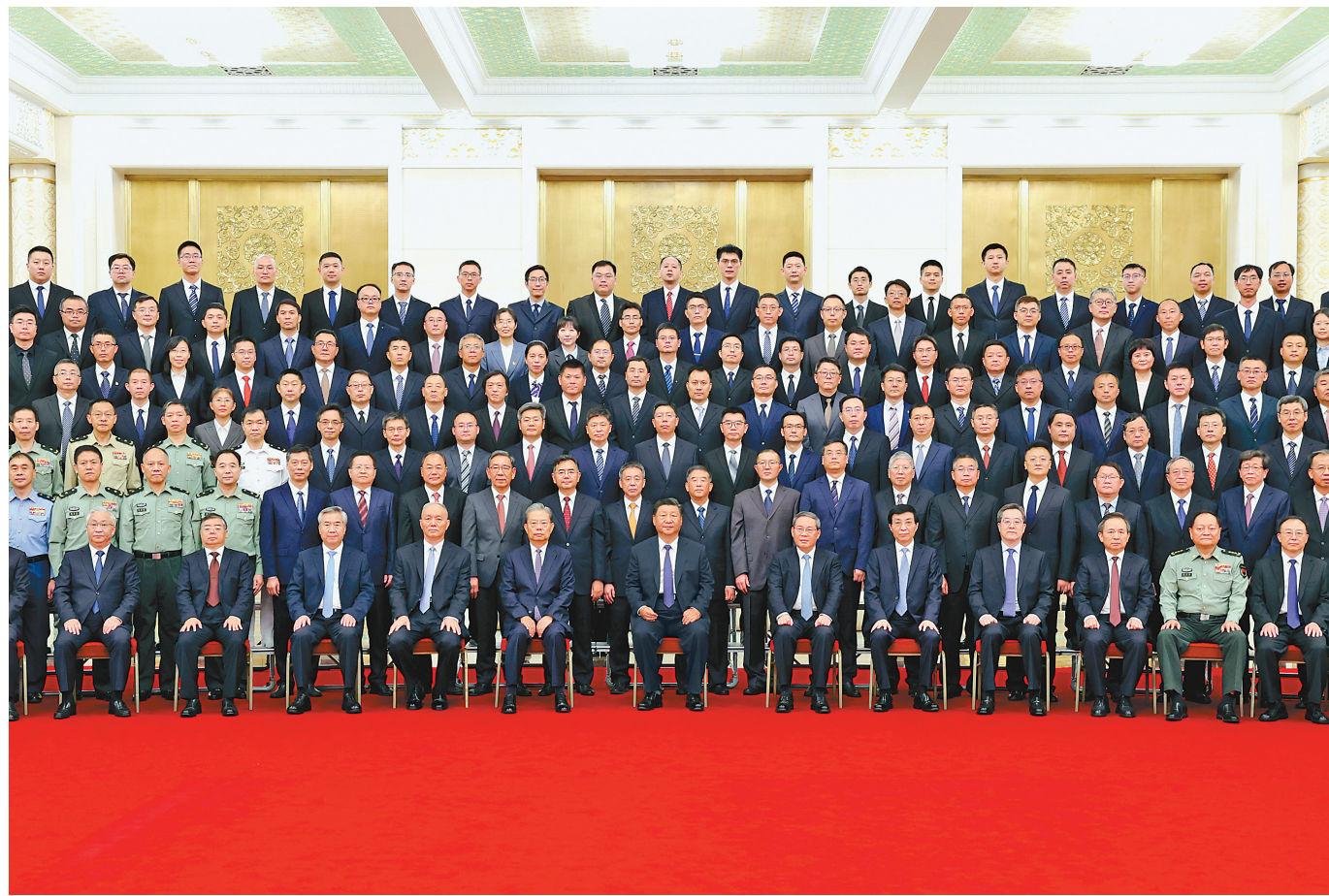
9月23日，党和国家领导人习近平、李强、赵乐际、王沪宁、蔡奇、丁薛祥、李希等在人民大会堂会见探月工程嫦娥六号任务参研参试人员代表并参观月球样品和探月工程成果展览。这是习近平等会见探月工程嫦娥六号任务参研参试人员代表。