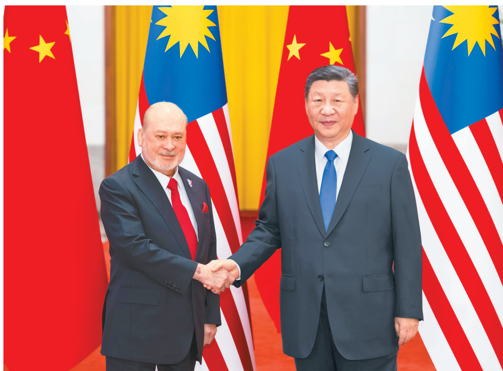
9月20日下午，国家主席习近平在北京人民大会堂同来华进行国事访问的马来西亚最高元首易卜拉欣举行会谈。