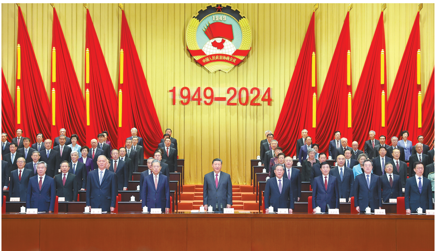
9月20日上午，中共中央、全国政协在全国政协礼堂隆重举行庆祝中国人民政治协商会议成立75周年大会。中共中央总书记、国家主席、中央军委主席习近平出席大会并发表重要讲话。