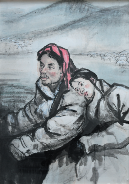
作品名称：《高原红石榴》 作者：曲沈韵