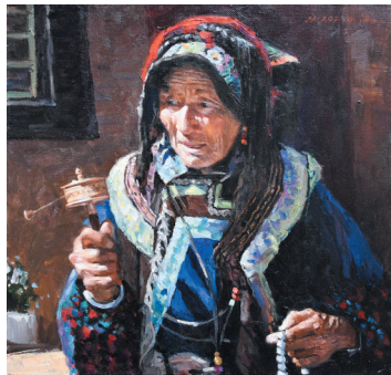
作品名称：《高原红石榴》 作者：尼珍

●主办单位：西藏自治区着力创建全国民族团结进步模范区专项组 ●协办单位：西藏自治区党委宣传部 西藏自治区民族事务委员会