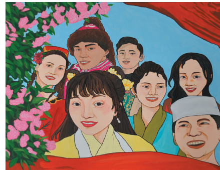
作品名称：《同心共筑心连心》 作者：尼珍