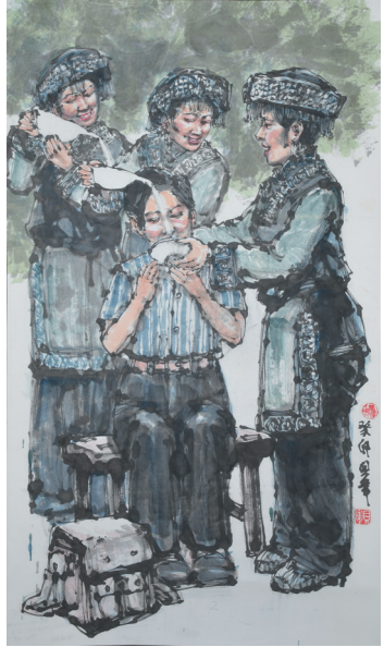
作品名称：《高原红石榴》 作者：尼珍