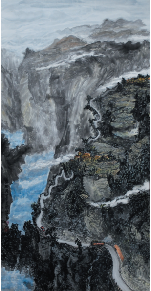
作品名称：《家乡美》 作者：尼珍