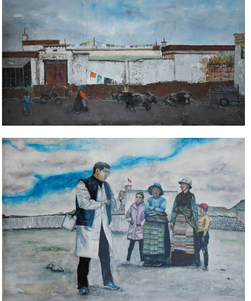
作品名称：《幸福好》 作者：尼珍