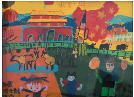
作品名称：《高原红石榴》 作者：曲沈韵