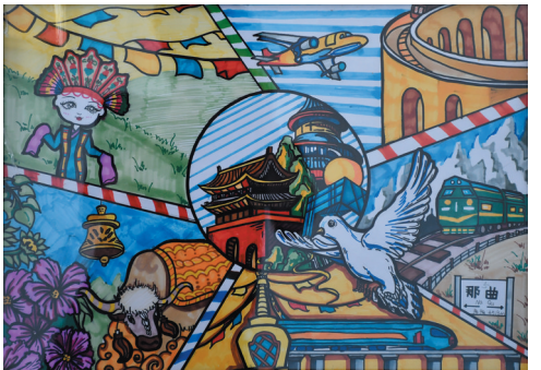
作品名称：《家》 作者：郭北