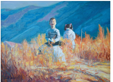
作品名称：《共筑美好家园》 作者：白玛曲吉