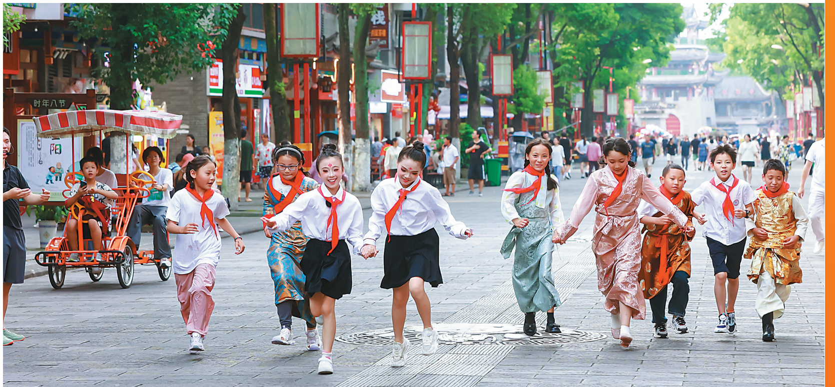
图为藏清两地学生手牵手奔跑在山城街头。

一批批援藏教师来到雪域高原,与西藏师生携手并进,铸牢中华民族共同体意识,促进两地师生的交往、交流、交融。为每一个离太阳最近的孩子搭建起一座座与区外交流的桥梁、打开一扇扇梦想的窗户,真正让教育大爱洒满雪域高原。