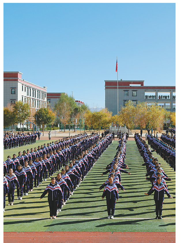
图为拉萨实验中学的学生在做课间操。