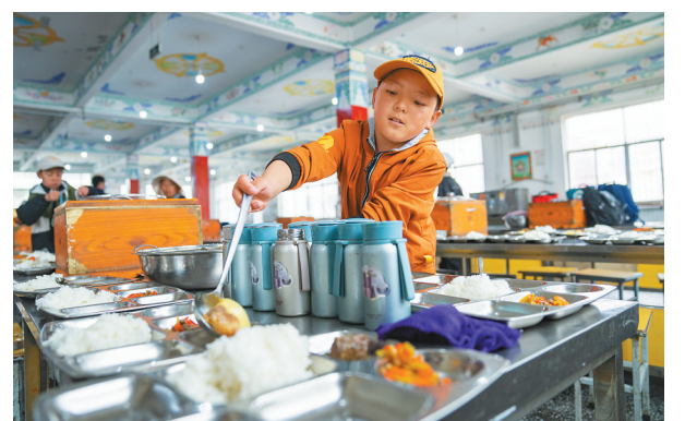
图为那曲市班戈县中石化小学学生在为同学们分发午餐(6月22日摄)。