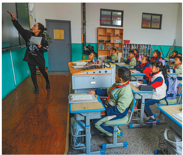
图为日喀则市青鸟小学学生在多功能媒体教室中学习。