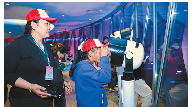
图为参加冬令营研学交流活动的波密少先队员在广州塔用共享望远镜眺望广州城市夜景。