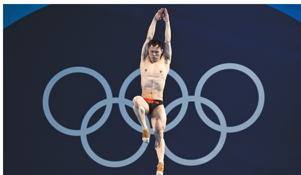
8月8日,在巴黎奥运会跳水项目男子3米板决赛中,中国选手谢思埸获得金牌,另一名中国选手王宗源获得银牌。图为中国选手谢思埸在比赛中。