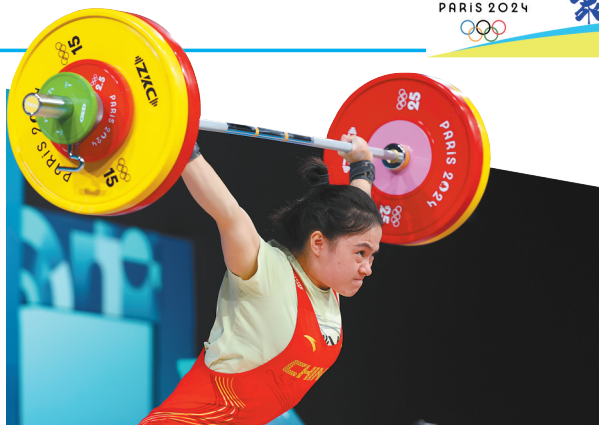
8月8日,在巴黎奥运会举重项目女子59公斤级比赛中,中国选手罗诗芳夺得冠军。图为罗诗芳在比赛中。