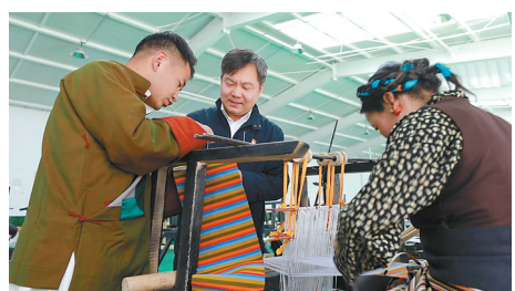
黑龙江援建的仁布县非遗民族手工业特色项目。

如今，在黑龙江援藏工作队和日喀则市各族干部群众的共同努力下，各受援县区产业发展兴旺，经济发展强劲，群众增收致富的“宝”越来越多。