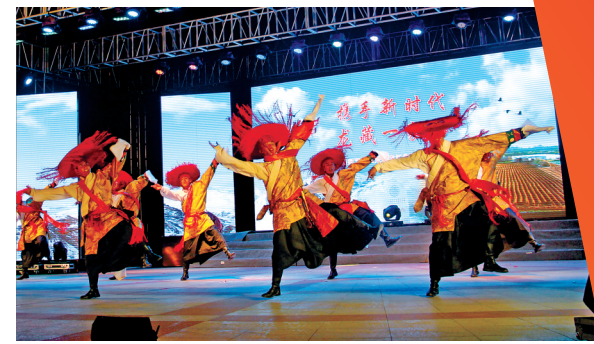
谢通门县民间艺术团赴黑龙江开展文化交流。