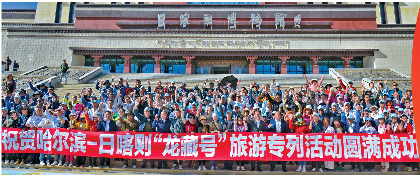
“龙藏号”旅游专列开通后迎来首批旅客。