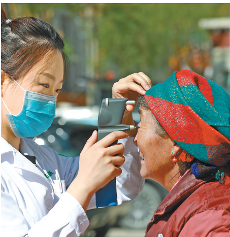
援藏工作队“雪域光明行”活动中，黑龙江援藏医生为群众检查眼睛。