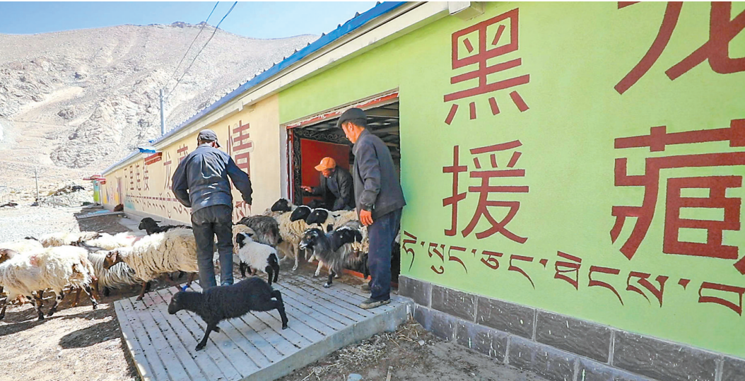
黑龙江援建的康马县牛羊暖圈项目。