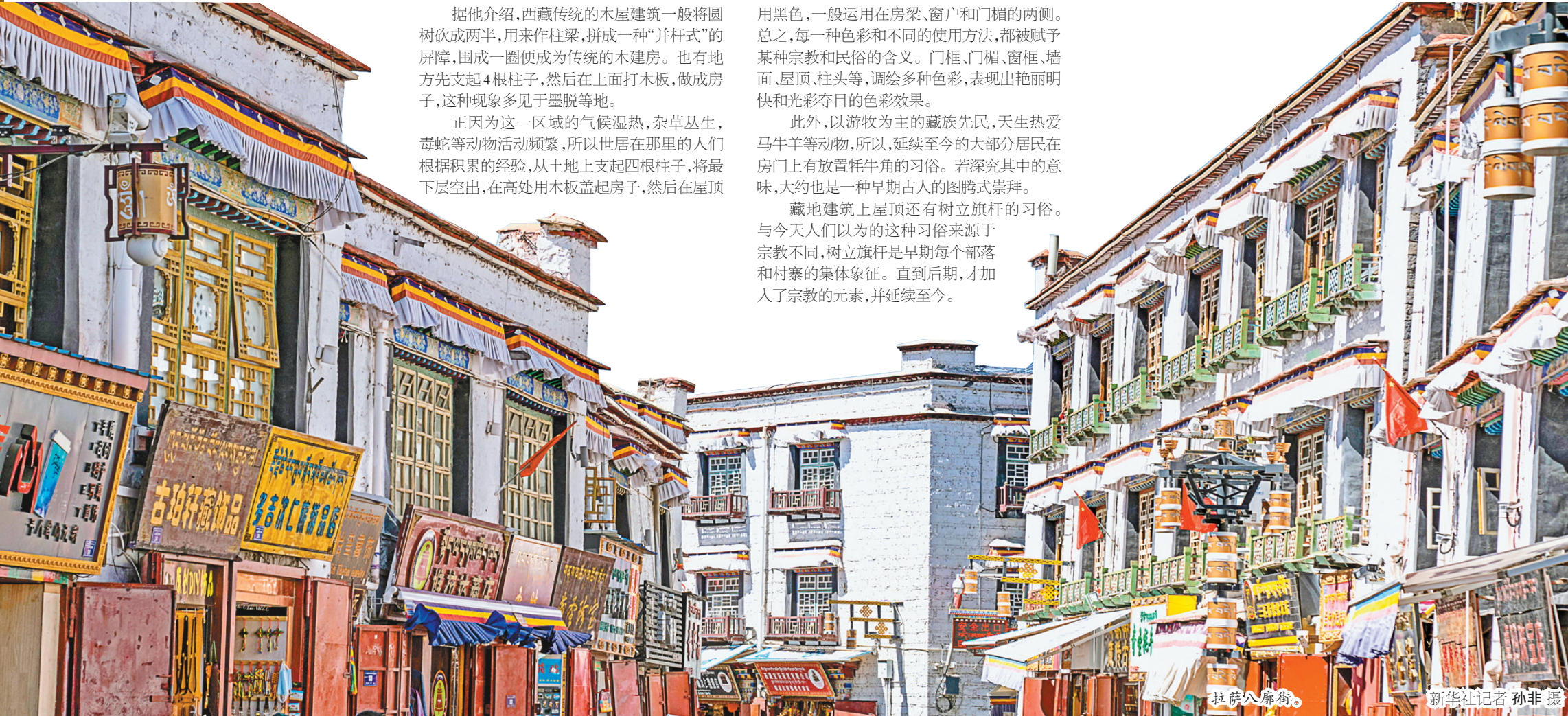
拉萨八廓街。