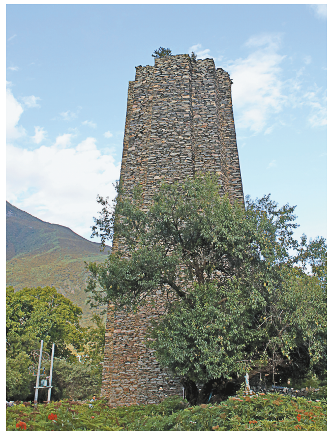
林芝玛堡。

藏地建筑上屋顶还有树立旗杆的习俗。与今天人们以为的这种习俗来源于宗教不同,树立旗杆是早期每个部落和村寨的集体象征。直到后期,才加入了宗教的元素,并延续至今。