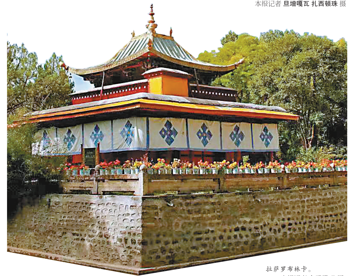
拉萨罗布林卡。

正因为这一区域的气候湿热,杂草丛生,毒蛇等动物活动频繁,所以世居在那里的人们根据积累的经验,从土地上支起四根柱子,将最下层空出,在高处用木板盖起房子,然后在屋顶