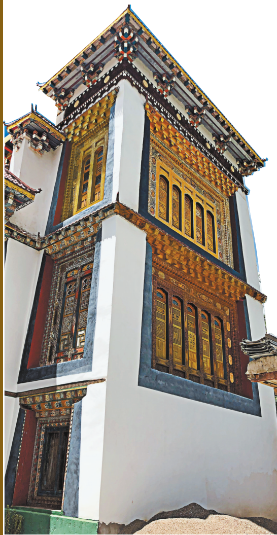
昌都东坝民居。