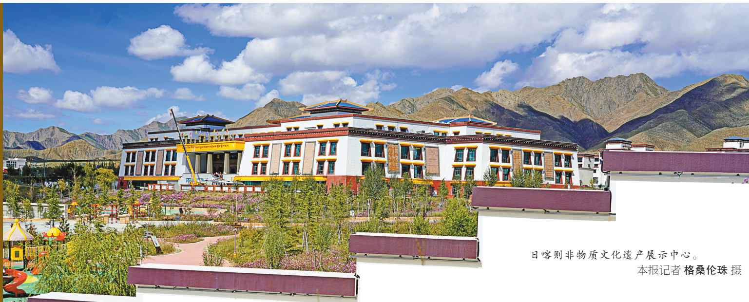
日喀则非物质文化遗产展示中心。