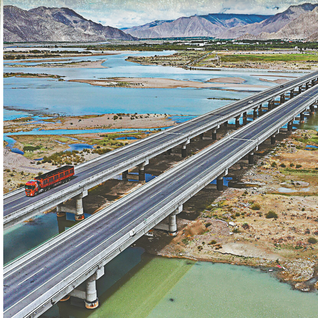
图为6月30日全线通车的拉日鲁高等级公路。

盛夏的八廓街，店铺林立，游人如织。2021年7月22日，习近平总书记走进八廓街，感慨地说：“千年八廓街，是我们各民族建起来的八廓街，各民族文化在这里交往交流交融，我们中华民族的大家庭在这里其乐融融。” 八廓街如一个缩影，传颂着西藏民族团结的故事，传颂着中华民族大家庭中各民族共同繁荣发展的故事。 在有着一千三百多年历史的八廓街周边，民族团结大院就有百余处。大街小巷中，处处都传颂着团结互助的佳话。 位于大昭寺西南侧的鲁园社区，生活着藏、汉、回、门巴、维吾尔、蒙古等多个民族的群众。从江苏来拉萨打工的许普金老人几年前不幸遭遇车祸，落下残疾，生活一度陷入困境。在社区居民和工作人员的关心和帮助下，老两口的生活渐渐有了起色。许普金常说：“他们虽不是亲人，却胜似亲人。” 许普金告诉记者，针对社区居民民族成分多样化的实际，鲁园社区居委会开办了“双语小课堂”，采取“双语字卡+高校毕业生志愿服务”的形式，既教藏族居民学习普通话，也教其他民族居民学习藏语，“语言通了，心灵的距离就更近了。” “我和家人来拉萨打工多年。这么多年来，邻居们相处融洽。逢年过节，藏族朋友会做象征五谷丰登的“切玛”送给我们这些邻居，大家聚在一起欢度节日。”许普金说，“尽管大家的生活习惯、语言、风俗不太一样，但大家都互帮互助，相处得像兄弟姐妹一样。” 在西藏，像许普金一样的故事还有很多。高原大地上，每每时刻都发生着各族群众如一家人的动人故事。各族群众手足相亲、守望相助，像石榴籽一样紧紧抱在一起，像爱护自己的眼睛一样爱护民族团结，凝聚起繁荣发展的磅礴力量。