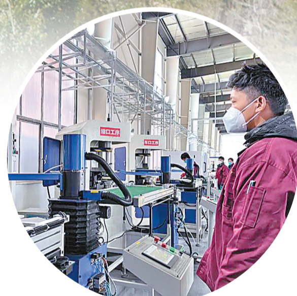
图为西藏兴辰科技有限公司工作人员在流水线上作业。