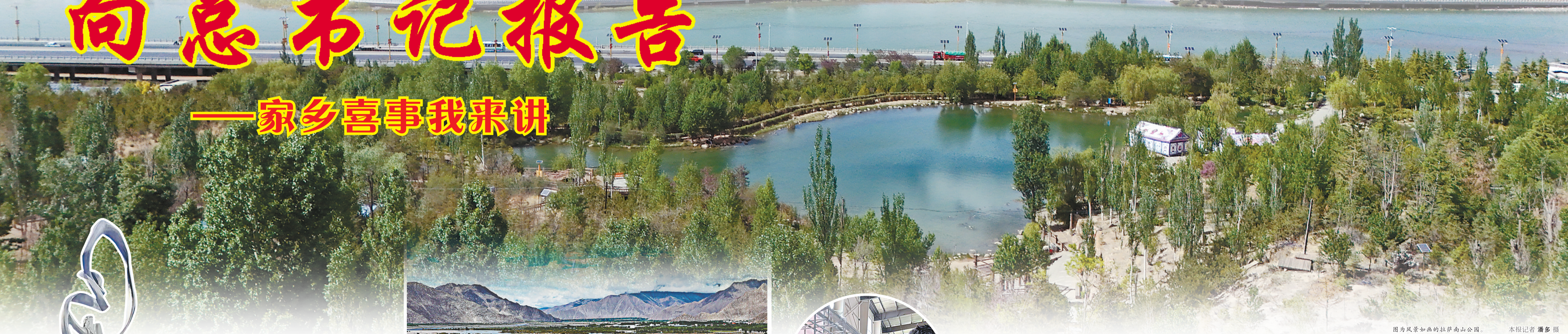
图为风景如画的拉萨南山公园。