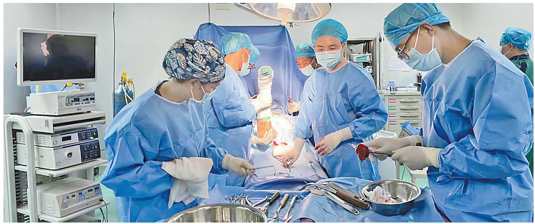
湖南省援藏医疗专家团队开展西藏首例胫骨逆行髓内钉内固定手术。