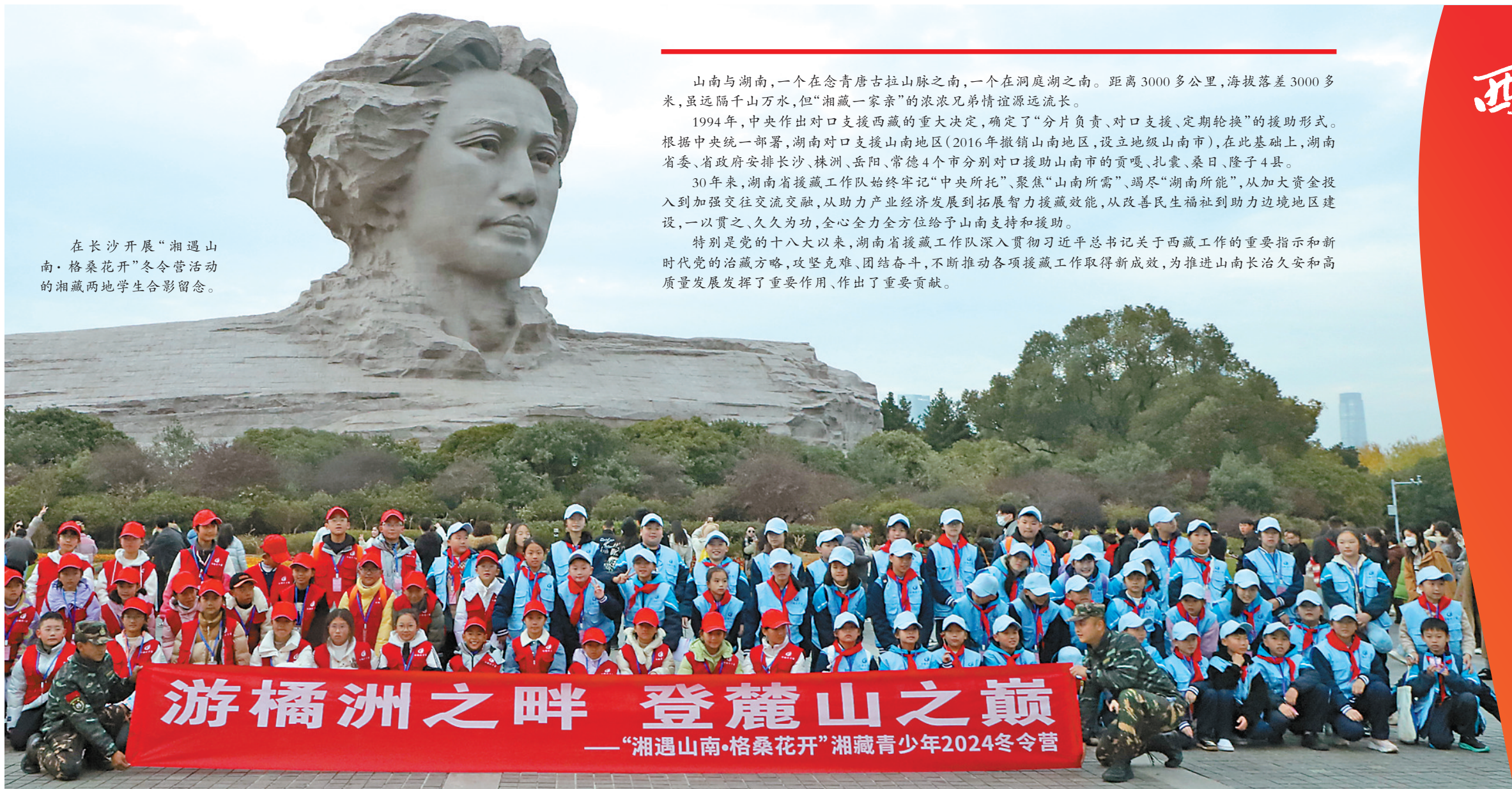
在长沙开展“湘遇山南·格桑花开”冬令营活动的湘藏两地学生合影留念。

山南与湖南,一个在念青唐古拉山脉之南,一个在洞庭湖之南。距离3000多公里,海拔落差3000多米,虽远隔千山万水,但“湘藏一家亲”的浓浓兄弟情谊源远流长。1994年,中央作出对口支援西藏的重大决定,确定了“分片负责、对口支援、定期轮换”的援助形式。根据中央统一部署,湖南对口支援山南地区(2016年撤销山南地区,设立地级山南市),在此基础上,湖南省委、省政府安排长沙、株洲、岳阳、常德4个市分别对口援助山南市的贡嘎、扎囊、桑日、隆子4县。30年来,湖南省援藏工作队始终牢记“中央所托”、聚焦“山南所需”、竭尽“湖南所能”,从加大资金投入、加强交流交融,从助力产业发展到拓展智力援藏效能,从改善民生福祉到助力边境地区建设,一以贯之、久久为功,全心全力全方位给予山南支持和援助。特别是党的十八大以来,湖南省援藏工作队深入贯彻习近平总书记关于西藏工作的重要指示和新时代党的治藏方略,攻坚克难、团结奋斗,不断推动各项援藏工作取得新成效,为推进山南长治久安和高质量发展发挥了重要作用、作出了重要贡献。