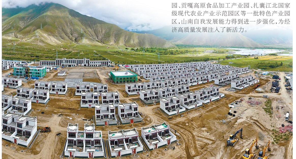
湖南省第十批援藏工作队和桑日县委、县政府合力打造的重点民生实事工程——桑日县扎嘎沟5个行政村整体搬迁项目。

引进一家龙头企业,带动一方经济发展。得益于湖南省援藏工作队健全的招商服务机制,近年来,引进了华钰矿业、华新水泥等一批产业关联度高、辐射能力强、带动作用大的产业项目,推动形成山南清洁能源装备制造产业园、贡嘎高原食品加工产业园、扎囊江北国家级现代农业产业示范园区等一批特色产业园区,山南自我发展能力得到进一步强化,为经济高质量发展注入了新活力。