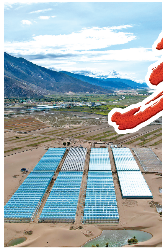
国家农业产业化示范企业——西藏绿之源现代农业科技股份有限公司二期项目,如同一片“绿洲”镶嵌在沙丘之中。