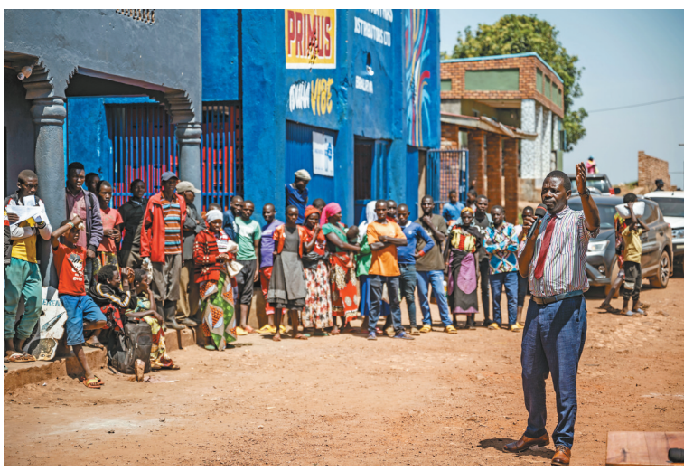
卢旺达大选将于7月15日举行。图为7月13日，在卢旺达吉昆比，独立候选人菲利普·姆帕伊马纳（右一）进行竞选演讲。