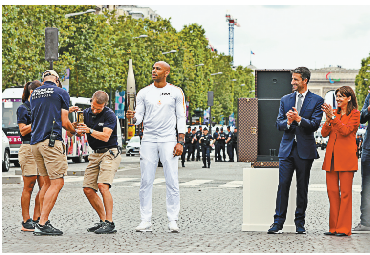
7月14日，2024年巴黎奥运会火炬在巴黎开始为期两天的传递。图为7月14日，在法国巴黎香榭丽舍大街，法国国奥队主教练、法国前足球运动员亨利（中）作为第一棒火炬手参加火炬传递。