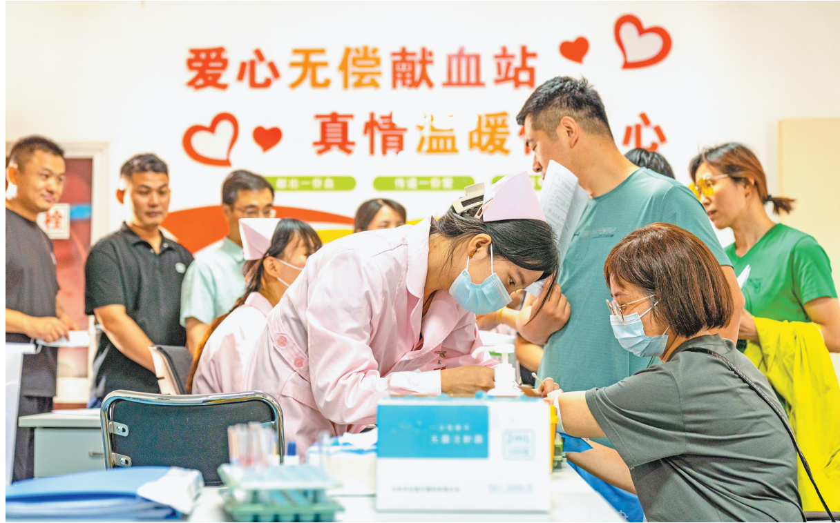
图为六月十四日，市民在安徽省合肥市肥东县献血站无偿献血。