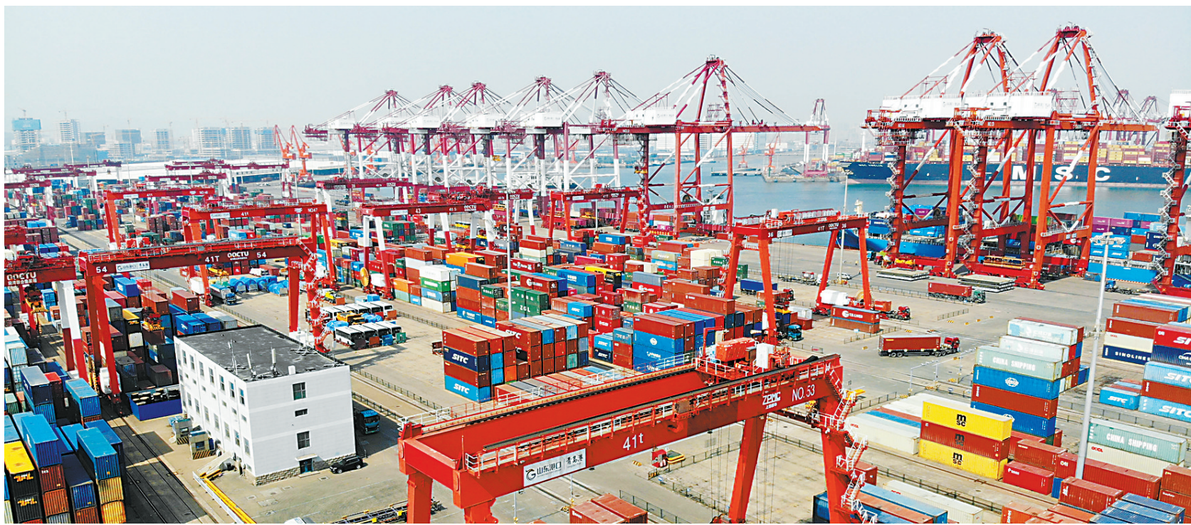
图为繁忙的山东港口青岛港前湾集装箱码头(资料图片)。