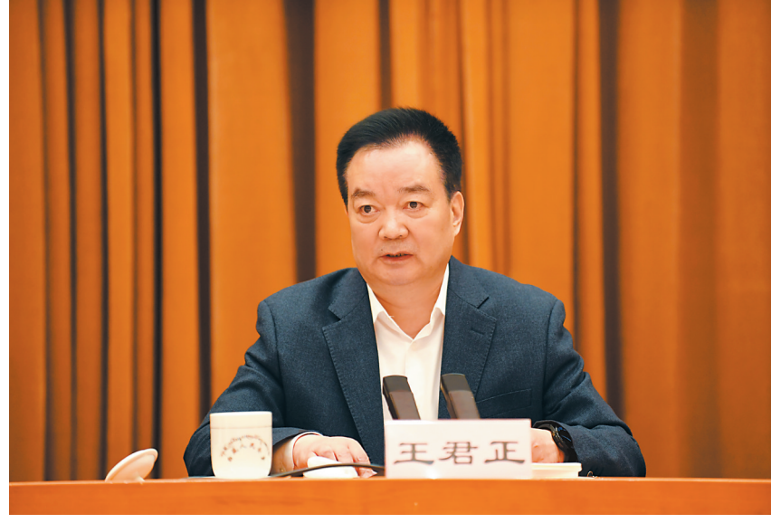
6月7日上午，全区党校工作会议在拉萨召开。自治区党委书记、自治区党委党校校长王君正出席并讲话。

新时代党校工作的重要意义，始终在思想上政治上行动上同以习近平同志为核心的党中央保持高度一致。坚持正确办学方向，把党校姓党原则贯穿到党校工作全过程各方面，使一切教学活动、科研活动都坚持党性原则、遵循党的政治路线。践行为党育才、为党献策初心，找准党校与党委中心工作的结合点，切实发挥学习引领排头兵、干部培训主渠道、思想理论主阵地、决策咨询新型智库的作用。 王君正强调，要突出工作重点，不断提高新时代党校办学治校水平。着眼建设高水平的干部培训基地，坚持实践锻炼和理论培训“两个课堂”一起抓，把学懂弄通做实习近平新时代中国特色社会主义思想摆在突出位置，用群众听得懂的语言和喜闻乐见的方式把党的创新理论宣传到基层、宣传到群众；大力开展党性教育、理想信念教育、党章和党规党纪学习教育，帮助领导干部提升政治能力、领导经济工作能力、科学决策能力、群众工作能力和在大局中思考问题、推动工作的能力。着力建设高水平的智库和理论高地，结合“稳定、发展、生态、强边”四件大事和“长治久安、高质量发展”两大战略目标，积极研究新情况、主动解决新问题，推出一批高质量、有特色的学术研究成果；压实意识形态工作责任，在大是大非面前旗帜鲜明、立场坚定、敢于亮剑，当好马克思主义在意识形态领域指导地位的坚定维护者、用党的意识形态引领社会思潮的可靠排头兵。 王君正强调，全区各级党校要进一步提高政治站位，充分认识加强和改进