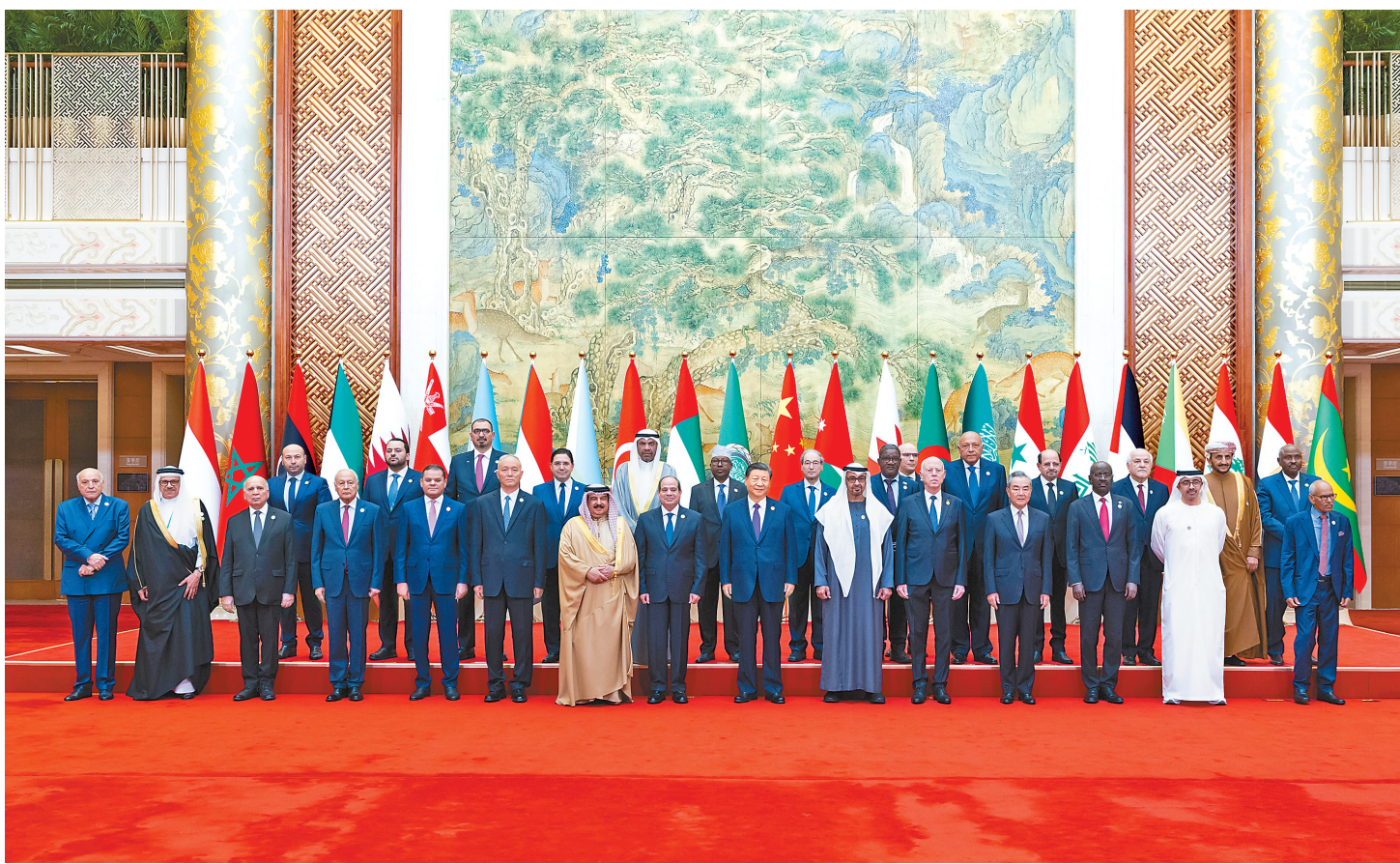
5月30日上午,国家主席习近平在北京钓鱼台国宾馆出席中阿合作论坛第十届部长级会议开幕式并发表主旨讲话。这是习近平同巴林国王哈马德、埃及总统塞西、突尼斯总统赛义德、阿联酋总统穆罕默德、阿盟秘书长盖特以及22位阿拉伯国家代表团团长集体合影。