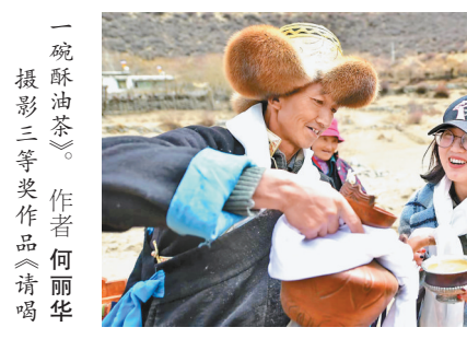
摄影三等奖作品《请喝一碗酥油茶》。