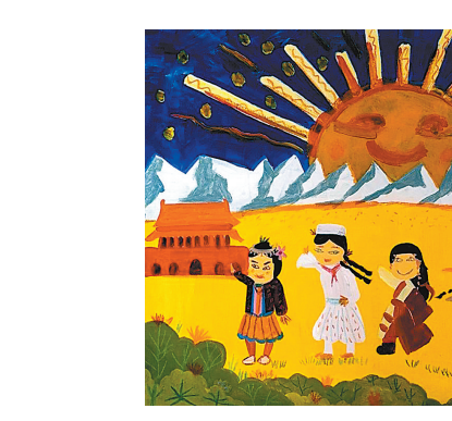
美术作品《童心筑梦》。作者 阿旺晋美