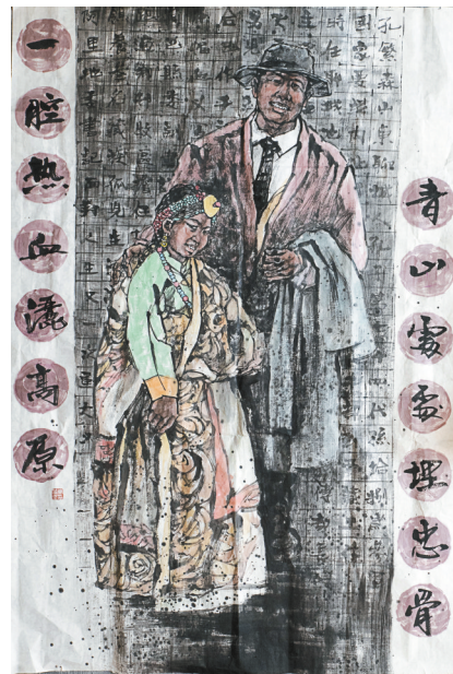
美术作品《孔繁森》。作者 唐国燕