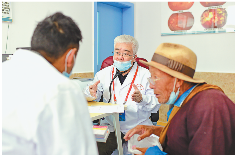
摄影一等奖作品《首都专家义诊 情暖高原乡亲》。