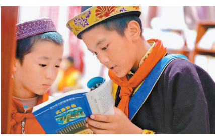
摄影二等奖作品《喜笑颜开》。