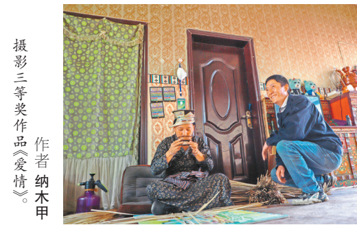
摄影三等奖作品《兄弟》。