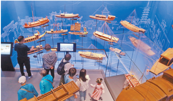
图为5月16日,观众在江苏扬州中国大运河博物馆参观。