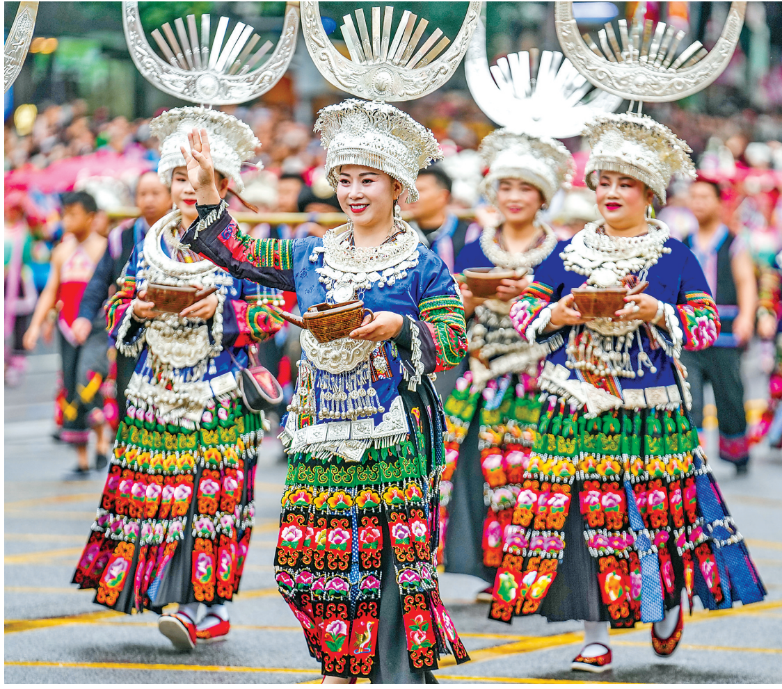
5月18日,“爽爽贵阳,‘媒’你相约”民族巡游大联欢在贵阳市举行。来自贵州省9个市(州)的3200余人组成29个方阵,配合3个主题装置进行巡游,集中展示了贵州的历史文化、民族文化、时代风尚和旅游特色。图为黔东南方阵的表演队伍在进行巡游。新华社记者 陶亮 摄