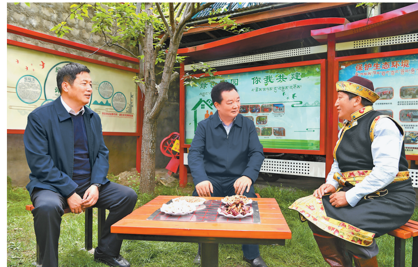
5月14日至16日,自治区党委书记王君正深入林芝米林市、朗县、巴宜区调研。这是王君正在朗县洞嘎镇卓村和村民巴珠亲切交谈。

本报巴宜5月16日电(记者 张黎黎 张尚华 刘文涛)5月14日至16日,自治区党委书记王君正深入林芝米林市、朗县、巴宜区调研。强调,要认真贯彻落实习近平总书记关于西藏工作的重要指示精神,完整准确全面贯彻新时代党的治藏方略,持之以恒抓好“稳