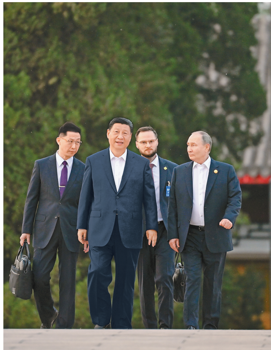
五月十六日晚,国家主席习近平在北京中南海同俄罗斯总统普京举行小范围会晤。