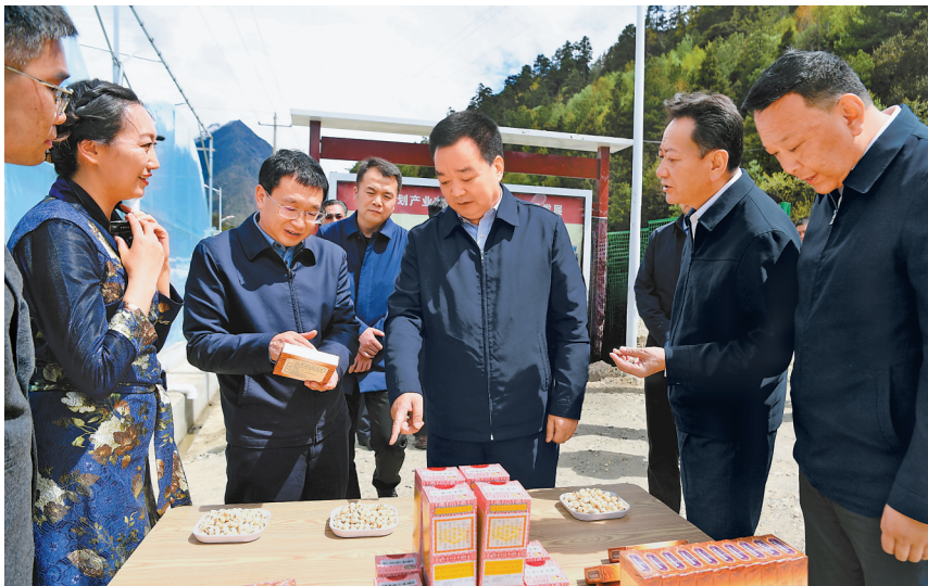
5月14日至16日,自治区党委书记王君正深入林芝米林市、朗县、巴宜区调研。这是王君正在米林市米林镇仲安安置点,实地了解“家门口”产业带动群众就业增收情况。