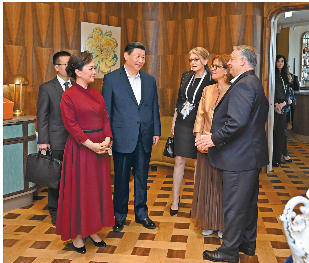
当地时间5月10日中午,国家主席习近平和夫人彭丽媛在布达佩斯应邀出席匈牙利总理欧尔班和夫人举行的饯行活动。