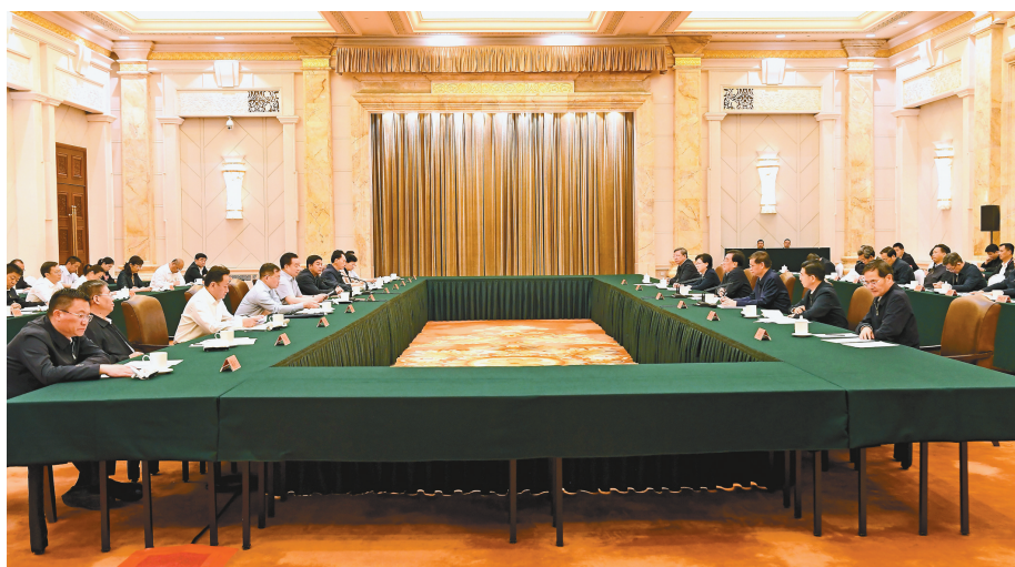
5月9日至10日,西藏自治区党政代表团赴江苏省学习考察。9日,江苏·西藏工作座谈会在南京召开。这是座谈会现场。