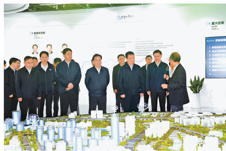
5月9日至10日,西藏自治区党政代表团赴江苏省学习考察。这是西藏自治区党政代表团在紫金山实验室考察网络通信与安全研发情况。

本报南京5月10日电(记者 张黎黎 黎尚华 刘文涛)5月9日至10日,西藏自治区党政代表团赴江苏省学习考察。9日,江苏·西藏工作座谈会在南京召开。西藏自治区党委书记王君正,江苏省委书记信长星出席并讲话。西藏自治区党委副书记、自治区主席严金海,江苏省委副书记、省长许昆林分别