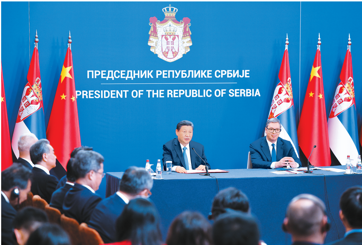
当地时间5月8日中午，国家主席习近平在贝尔格莱德塞尔维亚大厦同塞尔维亚总统武契奇会谈后共同会见记者。