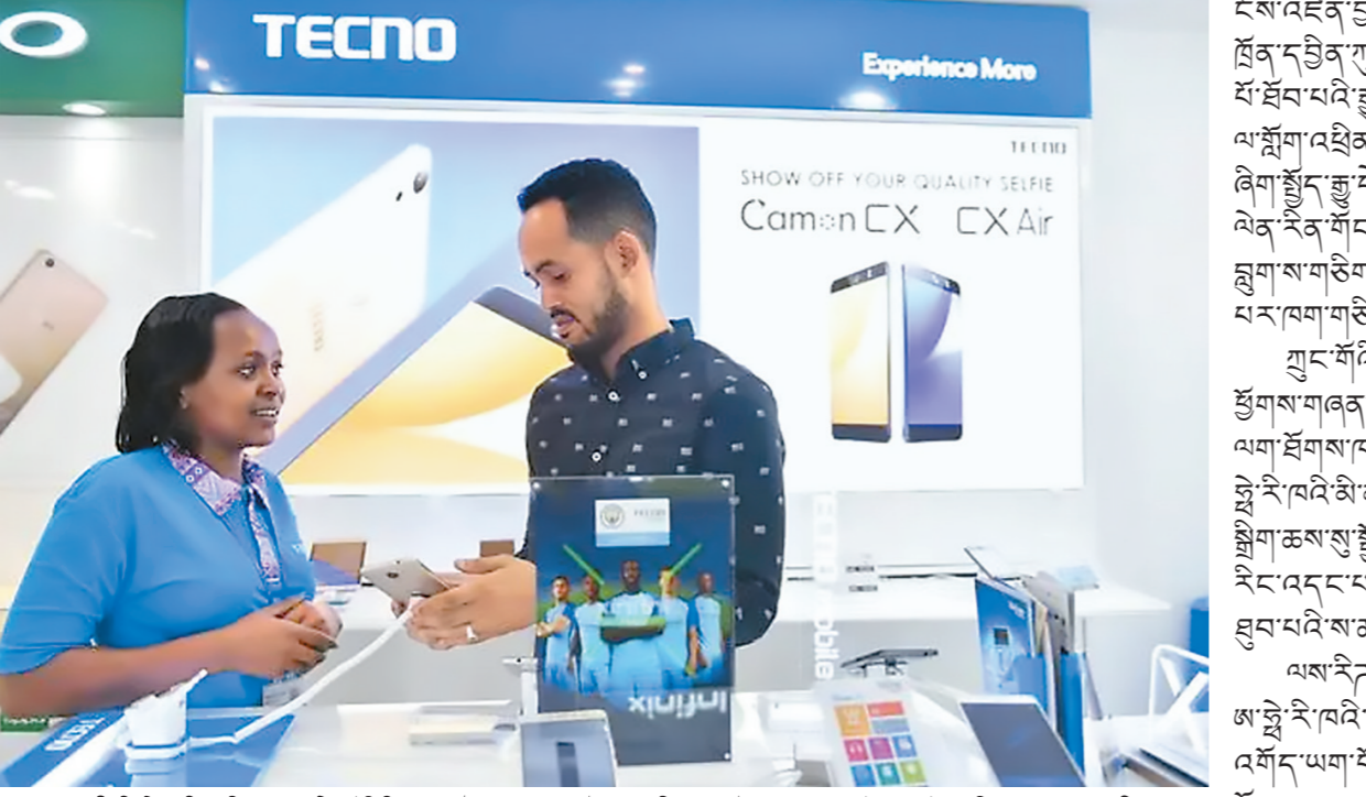
། འདི་ནི་མི་རྒྱལ་གྱི་མེ་ཏིང་གནས་བཤེན་སྐོར་ལྷན་ཚོང་གི་རྒྱུ་རྐྱེན་ལྷན་ཚོང་གི་བཞེས་པའོ།

ཀྲུང་གོའི་སྐྱོ་བརྟན་འགྱུར་མེད་ཀྱི་སྐྱོད་སྤྱོད་ལ་ཡིད་སྐྱོན་སྤོངས་བྱུང། འདི་ནི་མི་རྒྱལ་གྱི་མེ་ཏིང་གནས་བཤེན་སྐོར་ལྷན་ཚོང་གི་རྒྱུ་རྐྱེན་ལྷན་ཚོང་གི་བཞེས་པའོ།