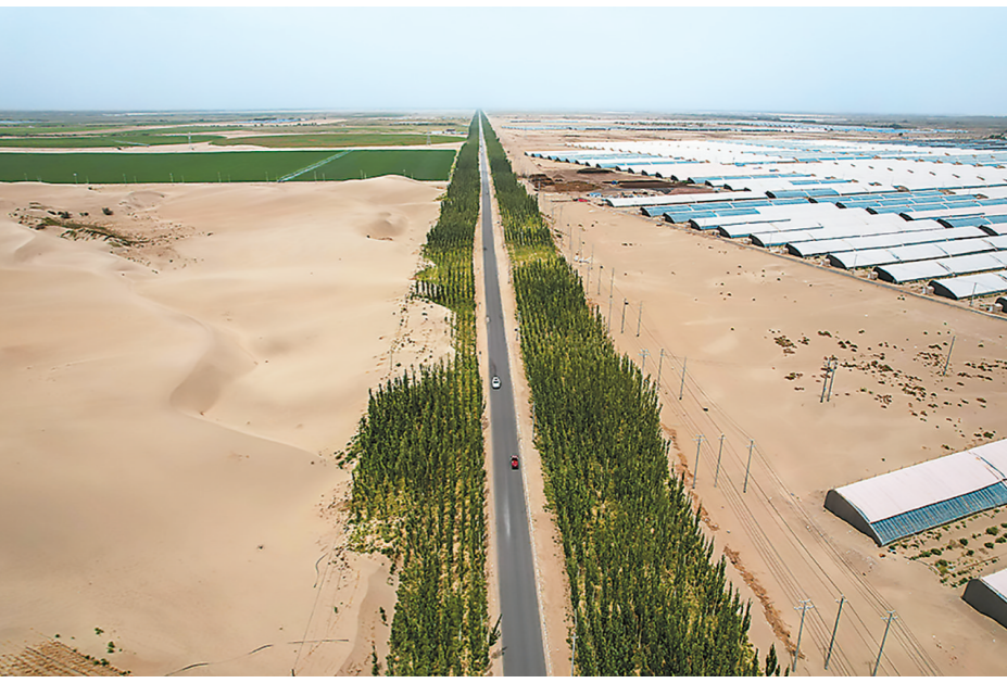
། འདི་ནི་མི་རྒྱལ་གྱི་མེ་ཏིང་གནས་བཤེན་སྐོར་ལྷན་ཚོང་གི་རྒྱུ་རྐྱེན་ལྷན་ཚོང་གི་བཞེས་པའོ།

མཁའ་རྒྱུད་སྐྱོད་འགྱུར་མི་ཚང་མ་མཐུན་སྒྲིལ་རྒྱུ་ལྟར་བྱེད་ཀྱི་འཇམ་ལྷོད་ལྱུང་ལོན་པར་རྒྱུ་ལྡན་གྱི་སྐྱོད་སྤྱོད་ལ་ཡིད་སྐྱོན་སྤོངས་བྱུང།