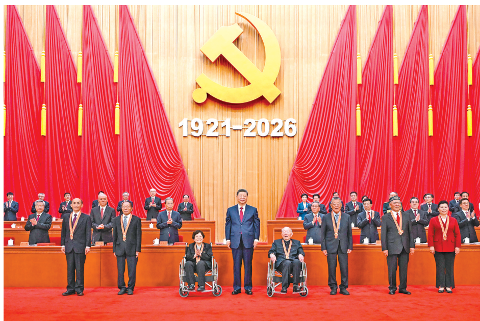
7月1日上午,庆祝中国共产党成立105周年大会在北京人民大会堂隆重举行。中共中央总书记、国家主席、中央军委主席习近平向“七一勋章”获得者颁授勋章。

新华社北京7月1日电 庆祝中国共产党成立105周年大会7月1日上午在北京人民大会堂隆重举行。中共中央总书记、国家主席、中央军委主席习近平向“七一勋章”获得者颁授勋章并发表重要讲话。他强调,105年来,我们党始终坚守为中国人民谋幸福、为中华民族谋复兴的初心使命,在不懈奋斗中创造了彪炳史册的伟大成就。新征程上,全党同志要坚定信心、接续奋斗,不断创造无愧于时代和人民的新业绩。