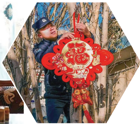
▲图为红“福”高悬迎新春。