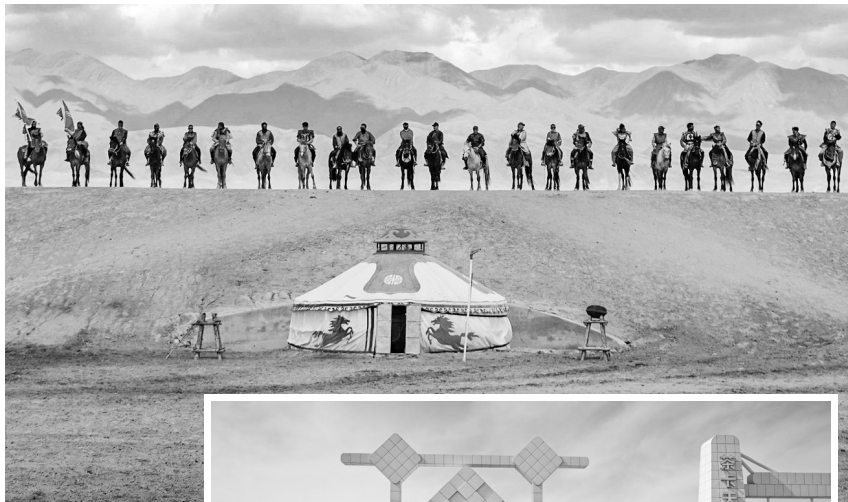
▲图为景区马队 迎宾与献哈达仪式。