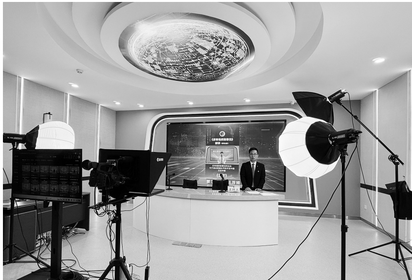
图为海西普法新媒体工作室。

从“大水漫灌”到“精准滴灌”,海西普法以新媒体为翼飞向群众。当法治成为触手可及的“指尖服务”,当法律成为群众的“家常话”,这片高原大地正孕育着蓬勃的法治生机。