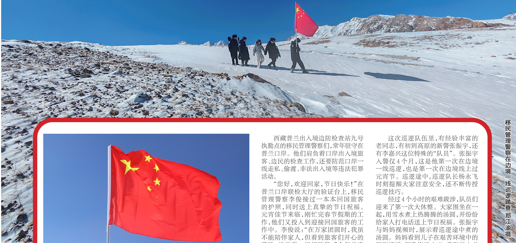
移民管理警察在边境一线巡逻路查