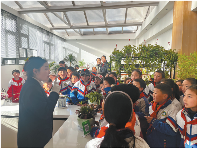
察雅县第二小学师生“沉浸式”参观法院,正在认真听干警介绍法院工作。

12月4日,昌都市察雅县人民法院开展以“送给孩子一束法治的光”为主题的“法院开放日”活动,邀请察雅县第二小学50余名师生“沉浸式”参观法院,“零距离”与法同行,切身感受法治力量,切实增强法治素养。