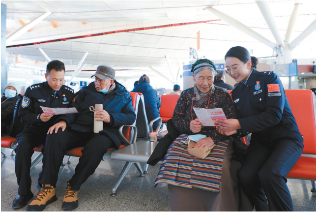
拉萨出入境边防检查站民警在机场开展法治宣传。

拉萨出入境边防检查站立足口岸特点和工作实际,依托“12·4”宪法宣传日、“法律九进”,扎实开展“宪法宣传周”系列活动,充分利用楼道多媒体播放系统滚动播放宪法相关专题报道,运用微信、学习强国等平台推送宪法学习资料30余篇,持续营造了浓厚的学习宣传氛围。组织民警职工开展宪法宣誓活动,共同宣誓坚决捍卫宪法和法律权威,表达了对党、对祖国、对人民的无限忠诚和庄严承诺。各支部通过开展国家宪法日座谈会、宪法知识竞答、网络旁听庭审等形式,多层次、多角度学思践悟宪法精神和习近平法治思想,推动全警尊崇宪法、信仰法治。法治岗位民警组成“宪法宣传小分队”,深入驻地商户及机场旅客开展普法宣传,采取发放法治宣传资料、解答群众法律咨询等形式,面对面向其普及预防未成年人犯罪、防范电信诈骗、预防校园欺凌等方面法律知识,宣讲出入境管理法、治安管理处罚法等宪法当中的地位作用,倡导辖区群众在维护自身合法权益的同时争做知法守法公民,推动宪法走进群众生活,走到群众身边,走入群众心里,得到群众和服务对象的一致好评。“通过讲解让我们个体商户对宪法有了更深的认识,学习到了与我们息息相关的维权方法和反诈知识。”机场常驻商户王先生说。