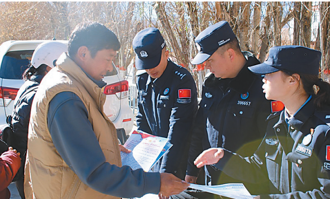
阿里边区管理支队普兰边境派出所开展宪法宣传活动。

12月4日,阿里地区普兰县公安局牵头,多警种参与在县文化广场组织开展的宪法宣传活动。