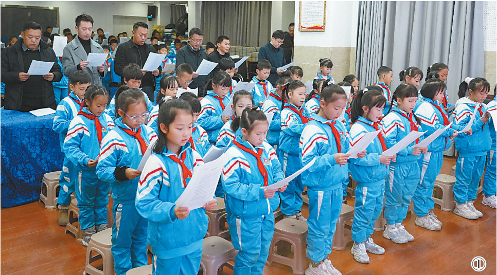
图①:大家与直播同步跟读宪法部分条款,跟唱《宪法伴我们成长》歌曲。

活动累计发放宣传材料500余份,发放宣传物品210余件,解答群众法律咨询30余人次。通过本次宪法宣传活动,让宪法理念深深扎根于广大民众心中,有效提升了全县群众的法治素养和法律意识,为构建和谐稳定、法治文明的县域环境迈出了坚实有力的一步。