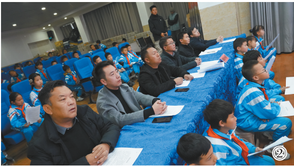
图②:大家认真观看全国教育系统“宪法晨读”活动。