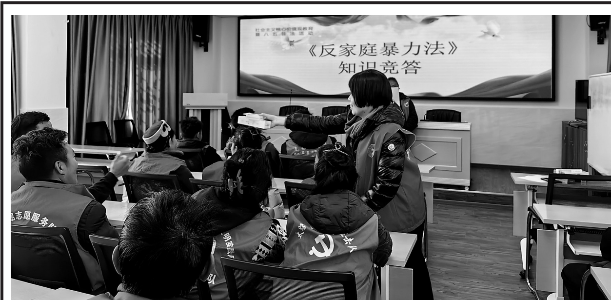
图为主题活动中,党员们踊跃参与《反家庭暴力法》知识竞答。

案件执结后,74件案件申请执行人五名代表专程来到定日县人民法院赠送锦旗,对执行法官“一竿子插到底”的执行精神表示感谢。