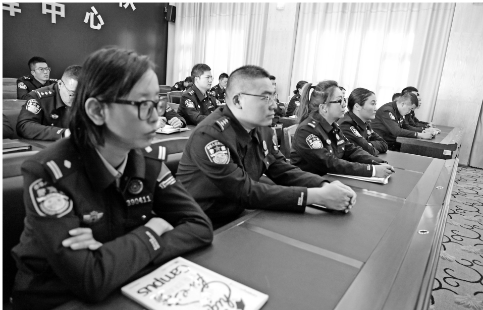
图为培训课上，民警集中学习党的二十届三中全会精神。