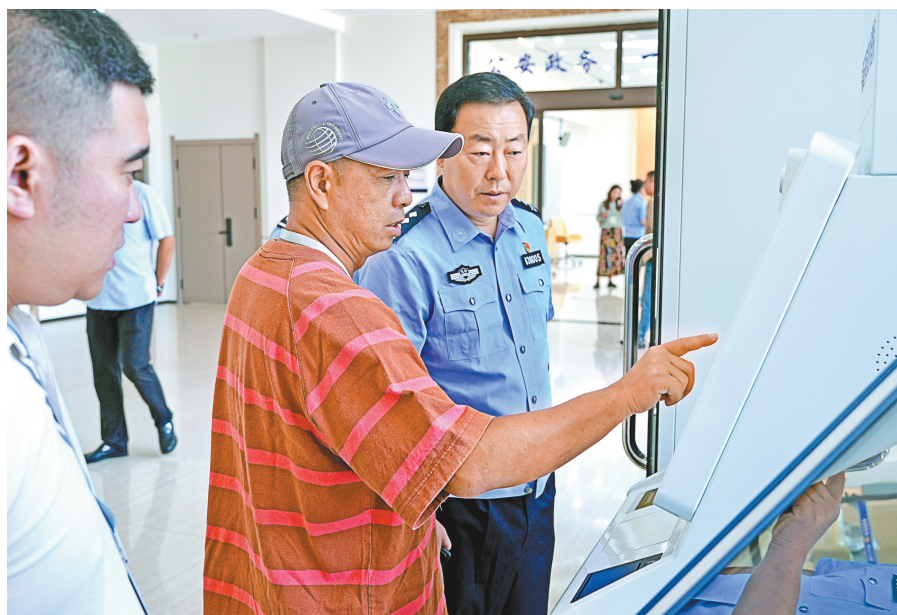
图为临江市公安局民警指导群众办理电子业务。

夜幕低垂,临江市的正阳路夜市灯火璀璨,市民人来熙往,摩肩接踵,处处洋溢着浓厚的生活气息与繁华景象。这背后,是临江市公安局正阳路警务站全体民警、辅警的默默坚守与无私奉献,他们如同夜空中最亮的星,守护着这片热土的安宁。