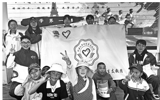
图为部分孩子和志愿者合影留念。

本报拉萨讯(记者 格桑伦珠)近日,团拉萨市委组织河海大学研支团、西部计划志愿者在城关区恩惠苑社区开展了2024新学期“恩海学堂”第一课。