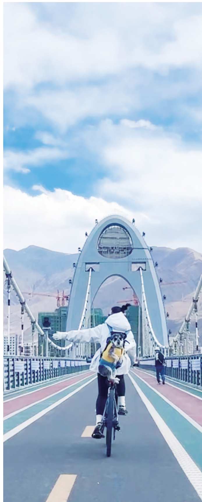
在“网红桥”上骑行的市民。