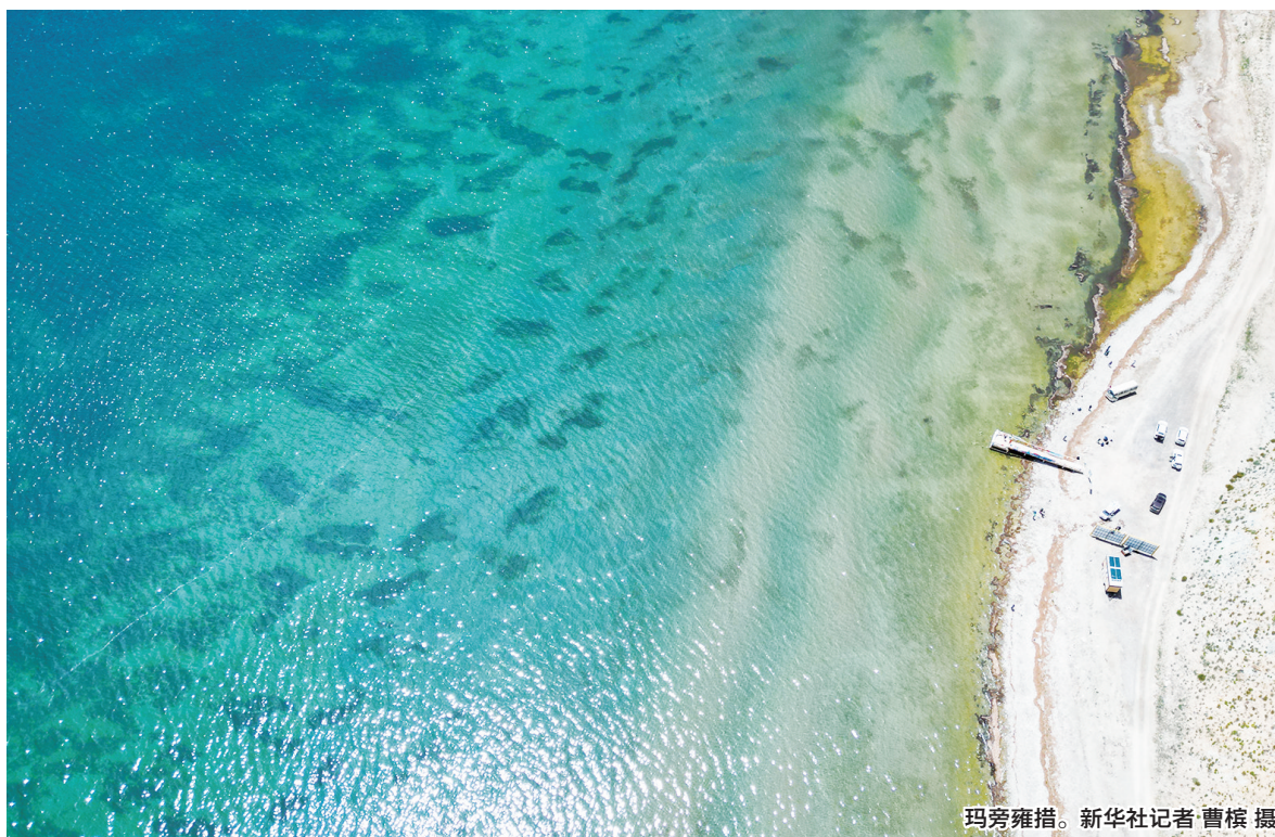
玛旁雍措。