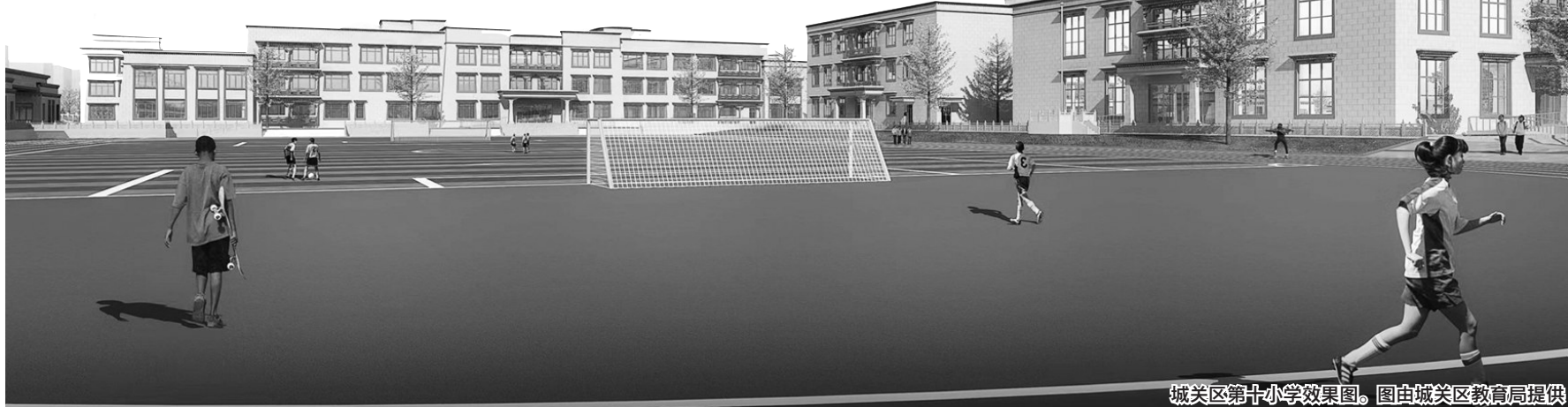
城关区第十小学效果图。图由城关区教育局提供