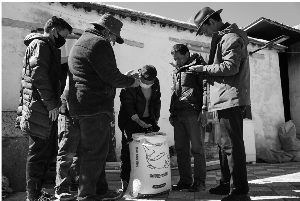
▲村民忙着开展春耕工作。