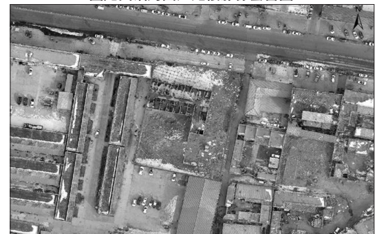
圆龙宾馆对面烂尾楼影像套合图

土地面积为3014.4072平方米(具体收回范围见附图)。请上述无主地相关权利人在本公告公示之日起15日内到那曲市色尼区自然资源局申明权利,逾期将按无主国有土地处置。