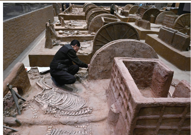
工作人员在河南安阳殷墟博物馆新馆的展厅内修复车马遗迹。

走进殷墟博物馆新馆,迎面而立的高墙上镌刻着一行醒目的大字,“苟日新,日日新,又日新”。《礼记》记载,这九字箴言是商王朝建立者汤的盘铭,向参观者展示了一个民族一以贯之的革新姿态、进取精神,展示了中华文明从历史中演化创造、于传承中生生不息的守正创新之道。