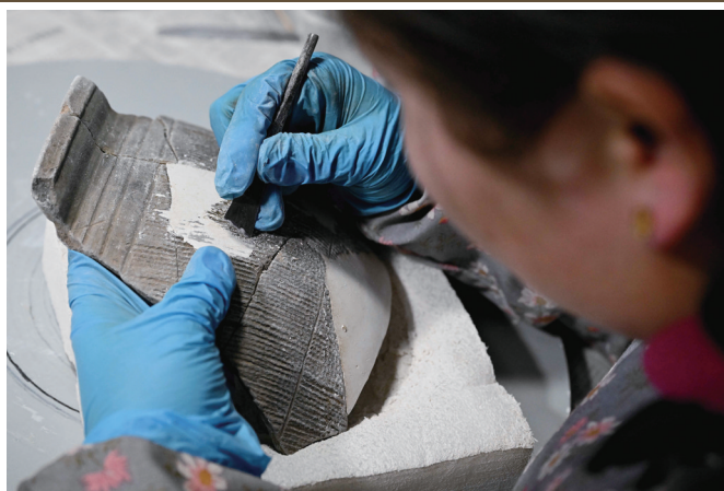
在中国社会科学院考古研究所安阳工作站,工作人员在对殷墟洹北高城出土的陶片进行整理修复。

2024年2月26日,首个全景式展现商文明的国家重大考古专题博物馆——殷墟博物馆新馆对公众开放。