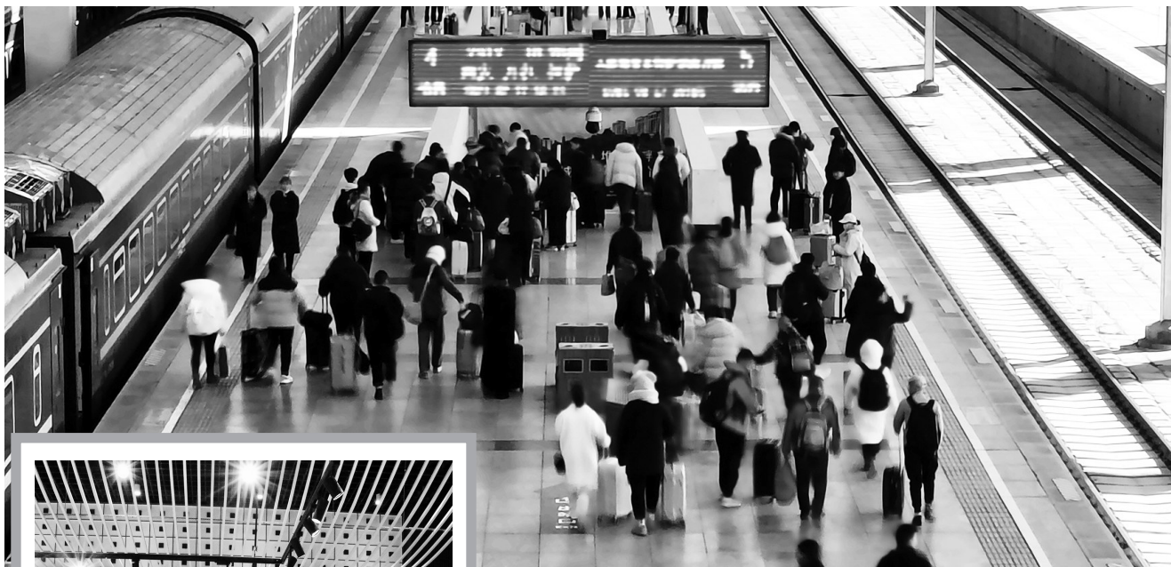
拉萨火车站旅客返程现场。

在此基础上,民航西藏区局监管局加强值班备勤,每日组织精干力量前往飞行区、航站楼、空管中心等地开展现场巡查监管;民航西藏区局空管中心重点关注节日期间值班人员思想、备勤状况,并针对航班运行、复杂天气、设施设备降效以及消防安全等风险领域提前分析研判,细化管控措施;西藏机场集团加强鸟击防范、同场运行管理、FOD“四圈层”治理、消防安全、跑道安全等“五项重点安全”工作,巩固“机坪规范化运行”成果,优化西藏辖区机场不利天气影响下的运行机制。