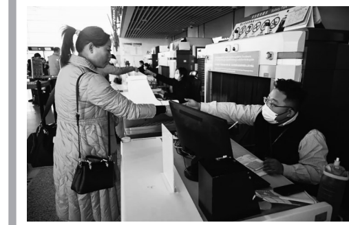
工作人员为旅客办理值机。