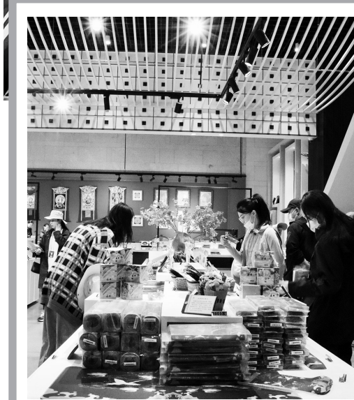
人们在文创体验馆选购商品。

面对节后学生、务工等客流明显增多,铁路客流继续保持高位运行的实际情况,青藏集团公司将充分运用12306大数据,科学分析客流规律,充分挖掘运输潜力,在客流集中的线路和区段加大运力投放,努力满足旅客出行需求。其中:进出藏方向继续安排使用5组青藏客套跑开行的方式,增加进出藏列车运力;拉日方向采取开行2对高峰线动车组的方式,满足日喀则与拉萨间旅客往返需求。