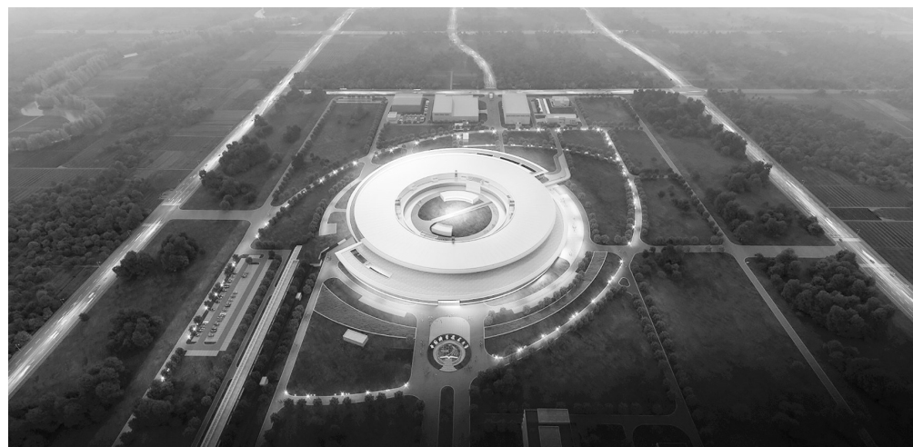
合肥先进光源效果图。

郑栅洁说,加大宏观调控力度,持续推动经济实现质的有效提升和量的合理增长,“有信心、有能力、有条件、有底气,不断推动经济结构持续向好、增长动能持续增强、发展态势持续向好”。