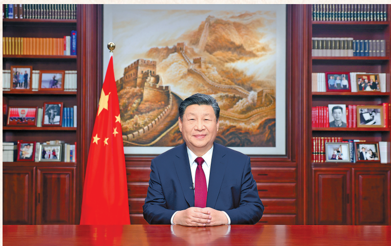
新年前夕,国家主席习近平通过中央广播电视总台和互联网,发表二〇二四年新年贺词。

这一年的步伐,我们走得很见神采。成都大运会、杭州亚运会精彩纷呈,体育健儿勇创佳绩。假日旅游人潮涌动,电影市场红红火火,“村超”“村晚”活力四射,低碳生活渐成风尚,温暖的生活气息、复苏的忙碌劲头,诠释了人们对美好幸福的