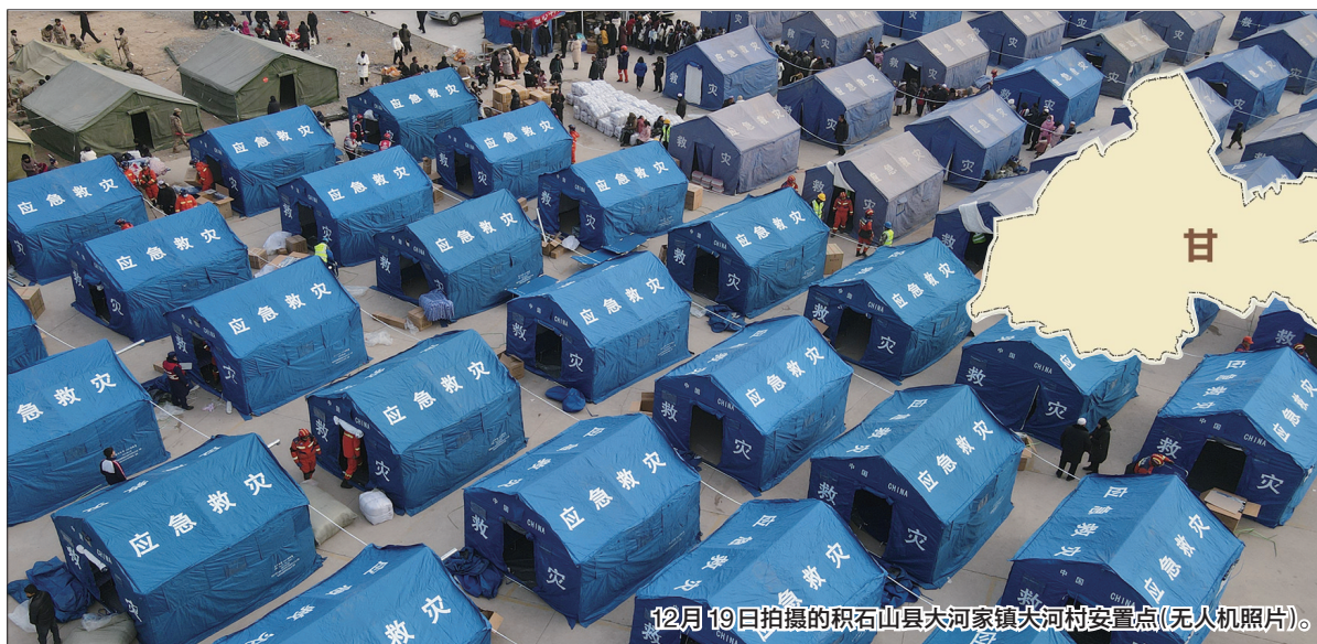
12月19日拍摄的积石山县大河家镇大河村安置点(无人机照片)。