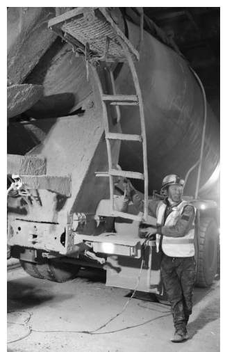
普巴隧道外施工。