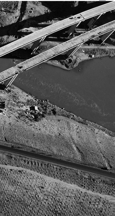
曲龙雅江大桥进入最后的沥青路面摊铺工序。