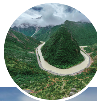
独俊大峡谷。图片