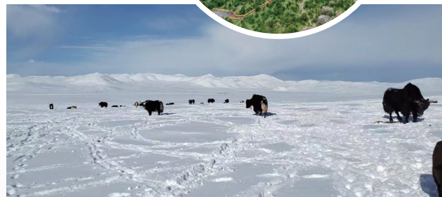
雪后的安多雁石坪大草原。