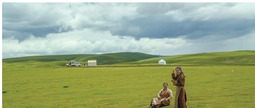
游客在羌塘草原上赏景游乐。

在羌塘草原,除了能看到常见的牛羊群,还有很大概率可以看到藏原羚和岩羊,幸运的话,还可看到藏羚羊。这些野生动物的存在,使羌塘草原多了一丝灵气。需要注意的是,看到野生动物请不要追赶、投喂。