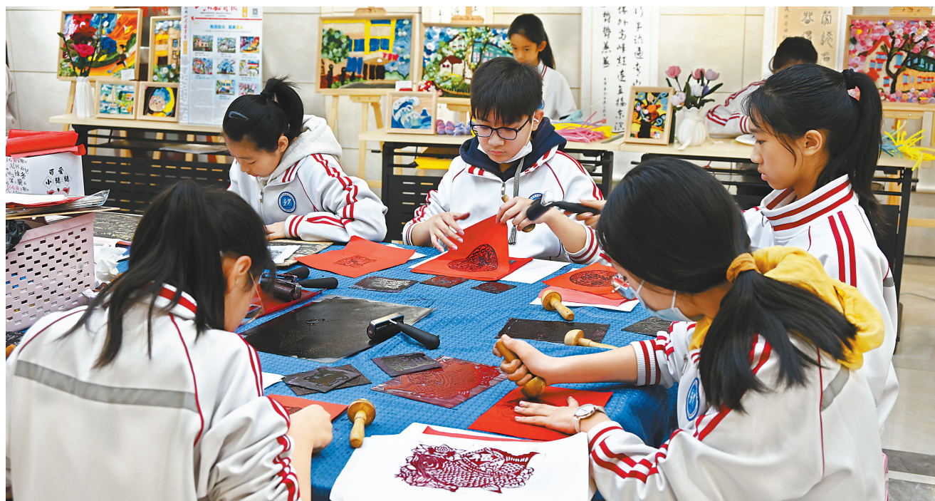
4月19日,山东省青岛第三十七中学举行“春日园游会”读书节开放日活动,学生通过美术创作、乐器演奏、手工制作等,集中展示近年来该校素质教育课程成果。