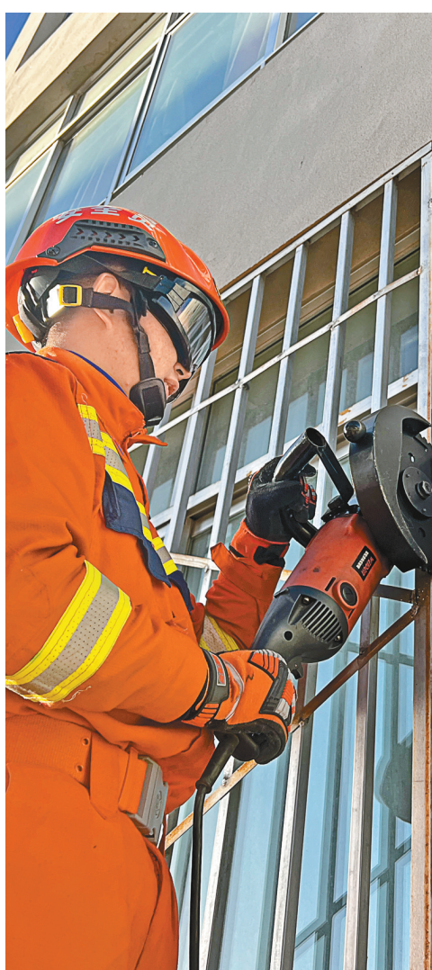
上图:消防员在学校“除窗破网”。右图:学校工作人员主动“除窗破网”。

主题党日浓氛围。连日来,全区各级消防救援队伍积极参加驻地组织的纪念西藏民主改革65周年“升国旗、唱国歌”仪式,与各族人民群众一道向国旗敬礼、向祖国致敬,并依托百万农奴解放纪念馆及驻地红色革命遗址、历史博物馆等思想教育基地,开展了多场参观见学主题党日活动。按照区直工委统一部署,总队机关联合区党委统战部、区教育厅、区财政厅前往西藏博物馆,开展“大手牵小手,奋进新征程”主题党日活动,“蓝朋友”与“红领巾”一起重温了从唐蕃会盟到江孜抗英,从十八军进藏到西藏和平解放,从民主改革到西藏自治区成立的恢弘历史画卷。那曲消防救援支队组织开展向党旗表白活动,邀请驻地农牧民群众到支队座谈交流,回顾光辉历史,激扬奋进力