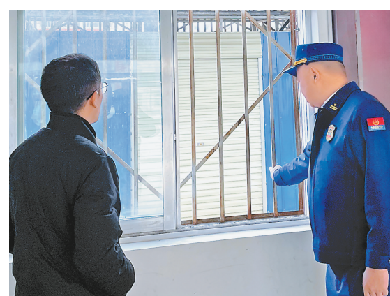
上图:消防员(右)向校方人员讲解防盗窗存在的安全隐患。