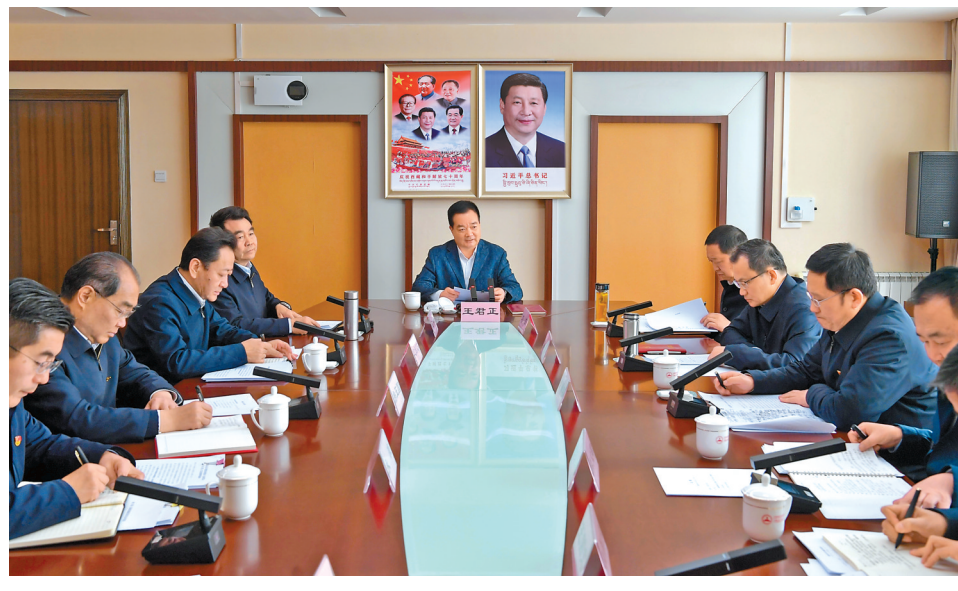
近日,自治区党委书记王君正在自治区党委党校(区行政学院)调研学校改革发展等情况,并主持召开座谈会。这是座谈会现场。

王君正指出,党的十八大以来,以习近平同志为核心的党中央高度重视党校工作,习近平总书记多次就党校工作作出重要指示批示,为新时代党校事业发展指明了前进方向,提供了根本遵循。全区各级党校要认真学习领会,深入贯彻落实,主动适应党员干部教育培训的新形势新任务,更